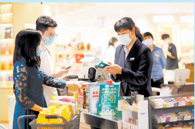
农行广东分行在广州试点推广数字人民币，进一步提升市民数字消费体验

截至2022年年末，农行广东分行各项贷款突破余额1.87万亿元，增量连续三年超2000亿元。