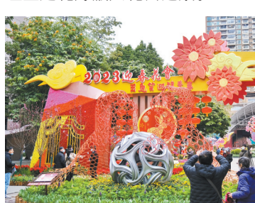
正门牌楼“迎宾门”景组融入兔子、花朵、貔貅等元素,展示喜庆地域特色

同时,出游要增强安全意识,谨慎参加高空、高速、水上、潜水、探险等高风险项目,不到没有正式开放开放区域、缺乏安全保障区域和私设“景点”旅游。注重文明旅游,不在文物古迹上涂刻,不攀爬、触摸文物古迹和展品。增强环境保护意识,不破坏当地自然景观、植被、地形地貌,保护生态系统和水体环境。遵守提示提醒,不在“网红”地从事危及自身以及他人人身安全的活动。