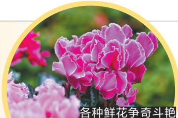
各种鲜花争奇斗艳