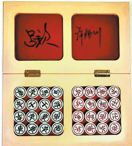
吕钦和许银川签名的迷你象棋

手头上有一盒精美的迷你象棋，木制的盒子，红丝绒内衬，象牙白的棋子温润如玉。那是第29届“五羊杯”的赠品，当时不知是不是运输过程的原因，其中一盒掉了一颗螺丝，盒子的开合就成了问题，于是就没了送出去，我厚着脸皮索要不，又趁工作之便，请吕钦和许银川两位大师送上