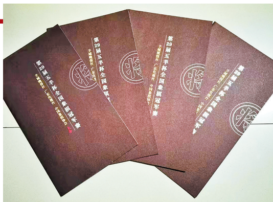
第29届“五羊杯”秩序册