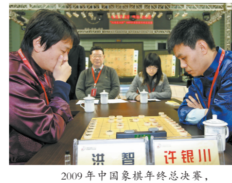
2009年中国象棋年终总决赛,许银川夺冠

羊城晚报记者 郝浩宇 詹淑真 瘦削的身材,温和的眼神,说起话来细声细语,带有潮汕地区特有口音的普通话让人听起来倍感亲切,这就是象棋特级国际大师许银川给人的第一印象。但只要坐在棋盘前,许银川的眼神就变得犀利起来,他棋风严谨细腻,又善于出奇制胜,18岁时就成为了全国冠军和象棋特级大师,被棋迷尊称为“许仙”。