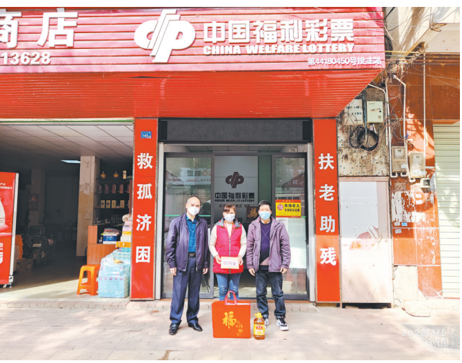
清远福彩为站点送上慰问金和礼品

在挖掘就业创业机会的同时，福彩系统还发挥公益金作用，助力就业。据了解，广东省深圳市投入福彩公益金资助阳光妈妈服务项目，为生活困难的单亲母亲、失业女性等提供就业公益服务。