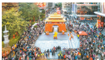
广州越秀西湖花市

兔年春节黄金周,广州成为全国热门旅游目的地之一,全市旅游接待和经营情况亮眼。“双增长”成绩单。春节黄金周7天,全市共接待市民游客983万人次,同比增长27.6%;旅游业总收入超过68亿元,同比增长25%;外地来穗游客超过312万人次,同比增长42.5%。