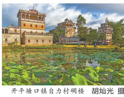
开平塘口镇自力村碉楼