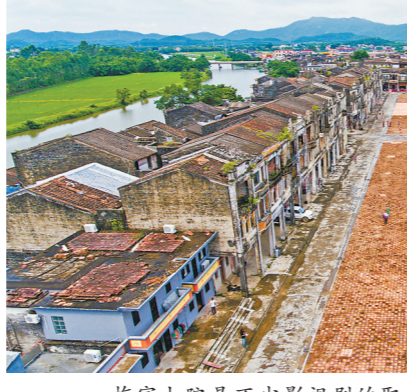
梅家大院是不少影视剧的取景地

作为《狂飙》的主要取景地,为江门旅游带来了极大关注。羊城晚报记者采访了江门市文化广电旅游体育局局长邱积康。