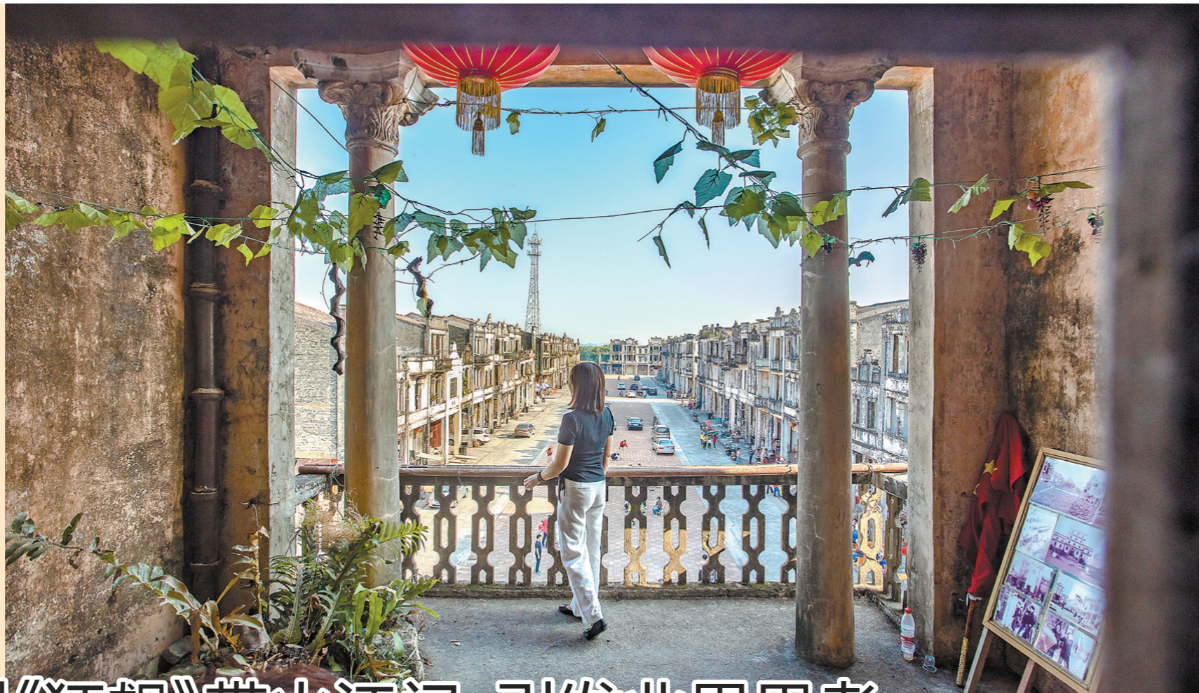
到梅家大院寻找原汁原味的侨圩印记

电视剧《狂飙》好评一路狂飙,作为剧中主要取景地的广东江门,这个春节假期文旅市场也开启“狂飙”模式。继《隐秘的角落》带火湛江后,广东又一座城因为一部热播剧而“出圈”。因为一部优秀的影视作品或者综艺节目带火一个拍摄地的现象不断,羊城晚报采访有关专家,探讨好的影视作品如此青睐广东的原因,在广东高质量发展大背景下,优秀的影视IP为广东文旅注入的新动能。