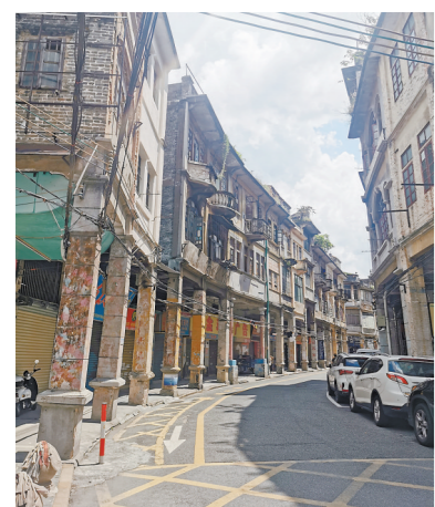
墟顶、北街、长堤等骑楼老道被统称为“三十三墟街”

把大部分拍摄场景选在江门,主要是看上了江门兼容并包的地域特色:“江门既保留了传统的老洋楼,也有浓厚的都市气息。随着剧情时间的推移,剧集环境背景也会跟着变化,突出强烈的时代特点,这些需求江门都能满足。让我印象很深的是,江门把传统骑楼街活化翻新后,聚集了奶茶、咖啡等新业态,把传统和现代元素很好地融合在了一起,体现了新旧时代的衔接,这正是我们所需要的。”