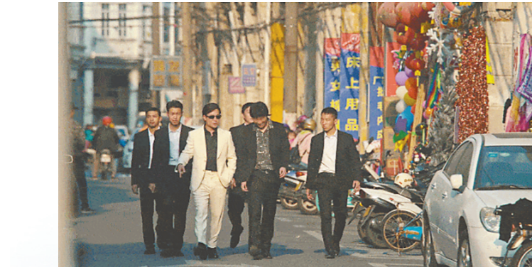
电视剧《狂飙》取景地就在江门(剧照)