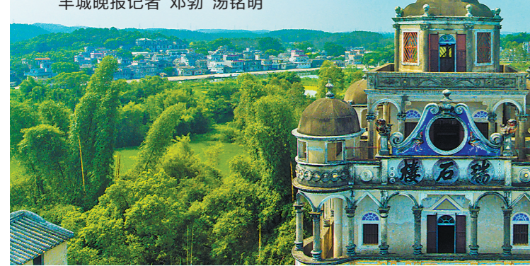
瑞石楼被誉为“开平第一楼”