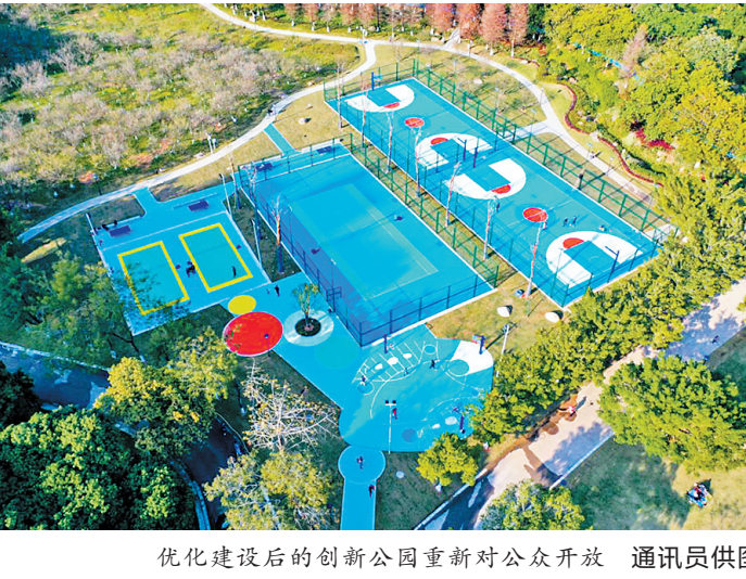
优化建设后的创新公园重新对公众开放

羊城晚报讯 记者徐振天、通讯员肖生萍、吴雅琦报道：近日，广州市黄埔区优化建设后的创新公园重新对公众开放，成为群众家门口的健身场所。创新公园位于黄埔区开源大道361号，公园总面积约为18万平方米。基于周边居民数量，重新建设后的创新公园，新增了一个面积约1200平方米运动广场和面积约5000平方米5人制足球场。运动广场包括篮球场2个、网球场（排球场）1个、羽毛球场2个、乒乓球台4张、儿童篮球场1个，并配套建设1个洗手池，配套绿化升级改造面积约2000平方米。