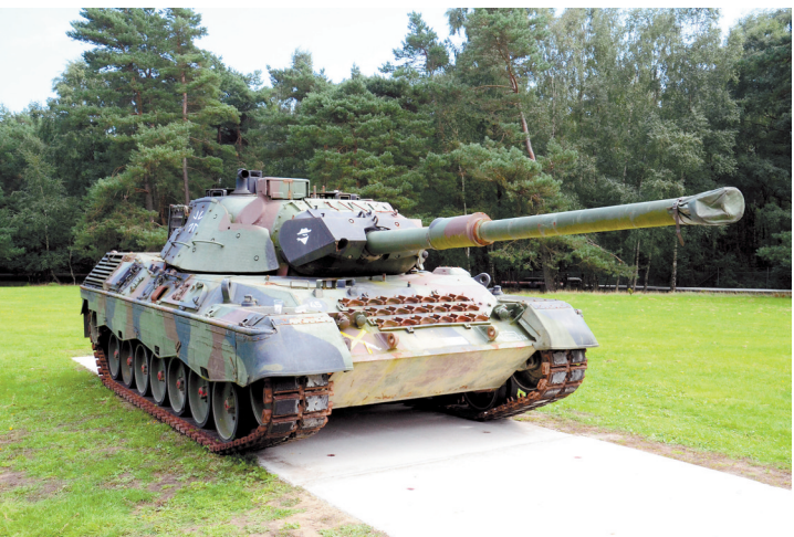
豹1型坦克(资料图片)

谈及新冠疫情,拜登说超百万美国人失去生命。美国不久后将结束公共卫生紧急状态,但仍需防控新冠病毒变异,继续加强疫苗和疗法研究。拜登表示,全球面临气候变化、公共卫生、粮食安全、恐怖主义等领域挑战。他说,美中竞争关系不应发展为冲突,美国致力于符合美国和世界利益的方向同中国合作。拜登还承诺在俄乌冲突中继续支持乌克兰。