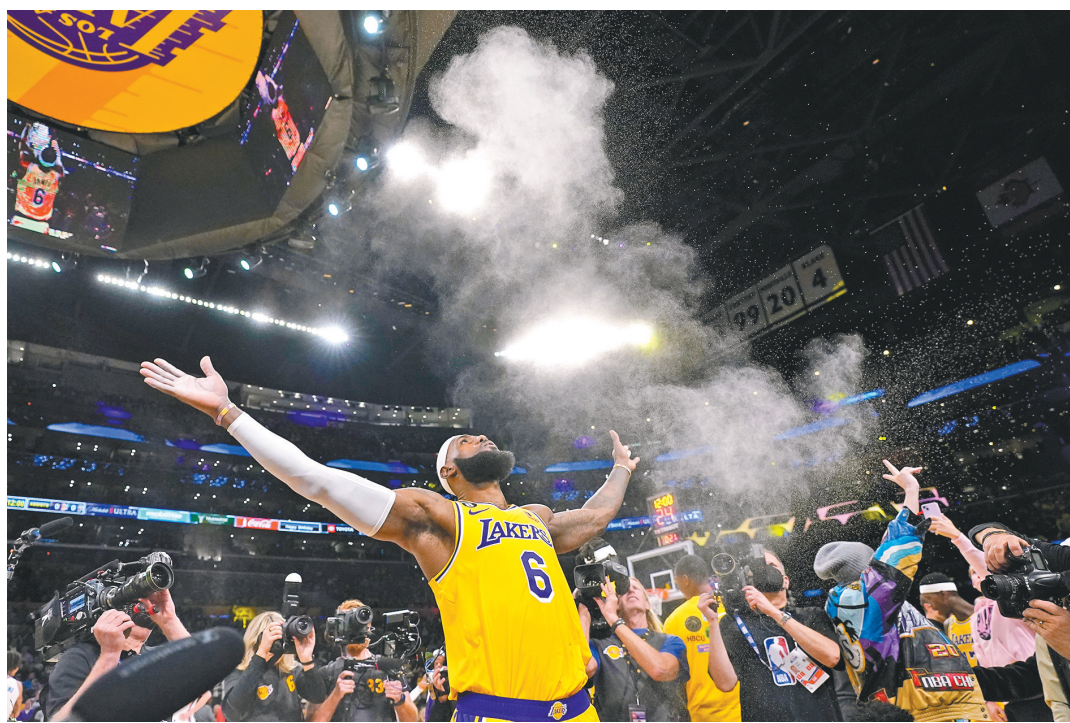
詹姆斯加冕得分王

还差6分、4分、2分……当詹姆斯距离登顶咫尺之间时,现场所有观众都屏住了呼吸。而当詹姆斯又一次稳稳地将篮球送入篮筐,NBA官方为这一传奇时刻叫出暂停,“MVP”的呼喊声响彻整座球馆。为了达成这一成就,38岁的詹姆斯花了20个赛季、1410场比赛,比贾巴尔少花了150场比赛。回顾詹姆斯的职业生涯,他场均能得到27.2分、7.5篮板和7.3助攻。