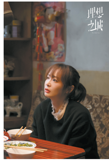
《理想之城》中饰演吴红玫