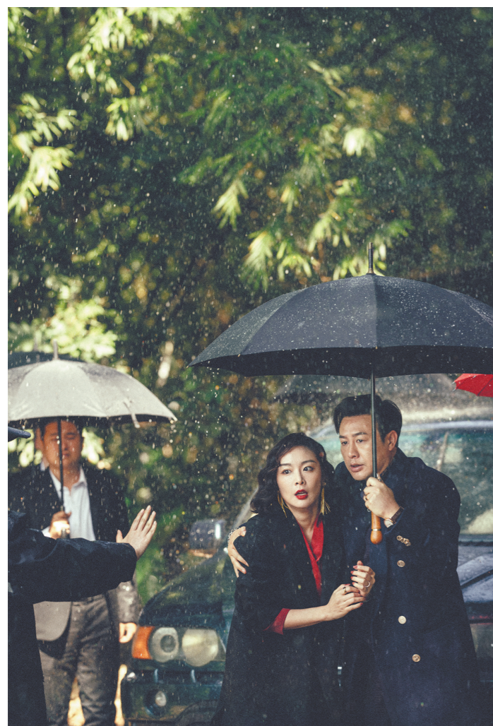
《狂飙》中高启强和陈书婷的中午爱情也很甜