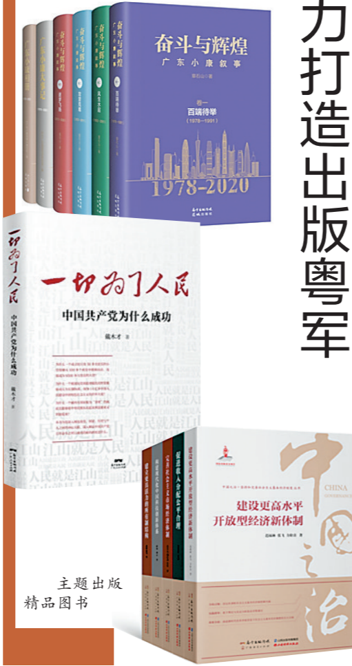
主题出版 精品图书

三要积极推动“文化+园区”。立足文化的核心定位,把握出版为基、运营为先两个着力点,整合关联资源,聚合产业要素,建设文化产业产业园区。利用产业园区在资源整合、模式创