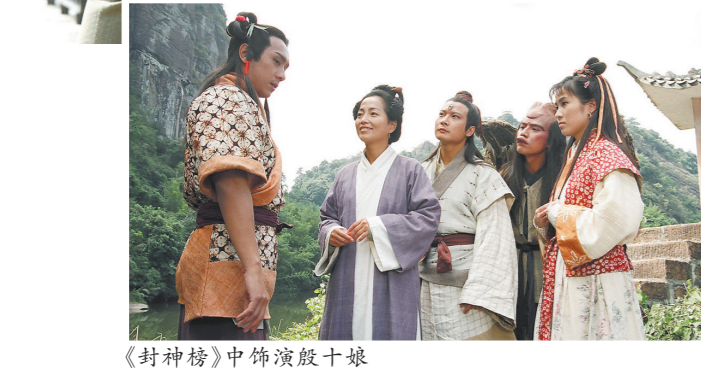
《封神榜》中饰演殷十娘