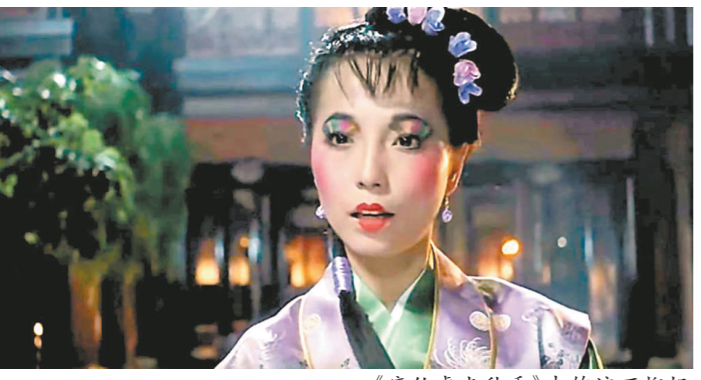
《唐伯虎点秋香》中饰演石榴姐

还有，这里的东东西西太好吃了！比如生腌、潮汕的生腌跟淮扬的生腌很不一样，不同地方的火锅又有不一样的风味。这里的美食多如天上繁星，对我这种爱吃的人来说，真的太棒了！