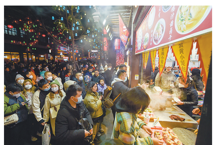
消费者热烈追捧美食