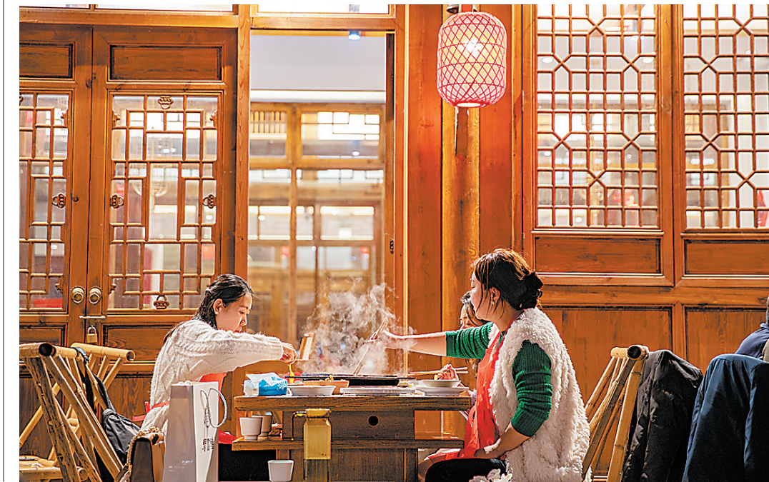
餐饮企业就餐环境在提升