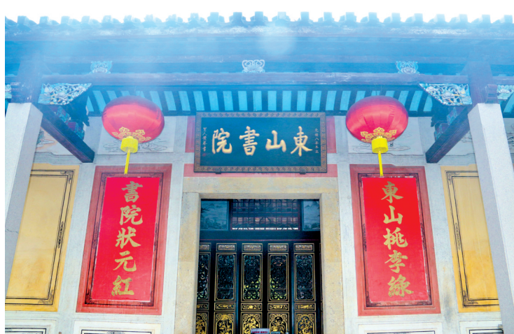
东山书院学风鼎盛