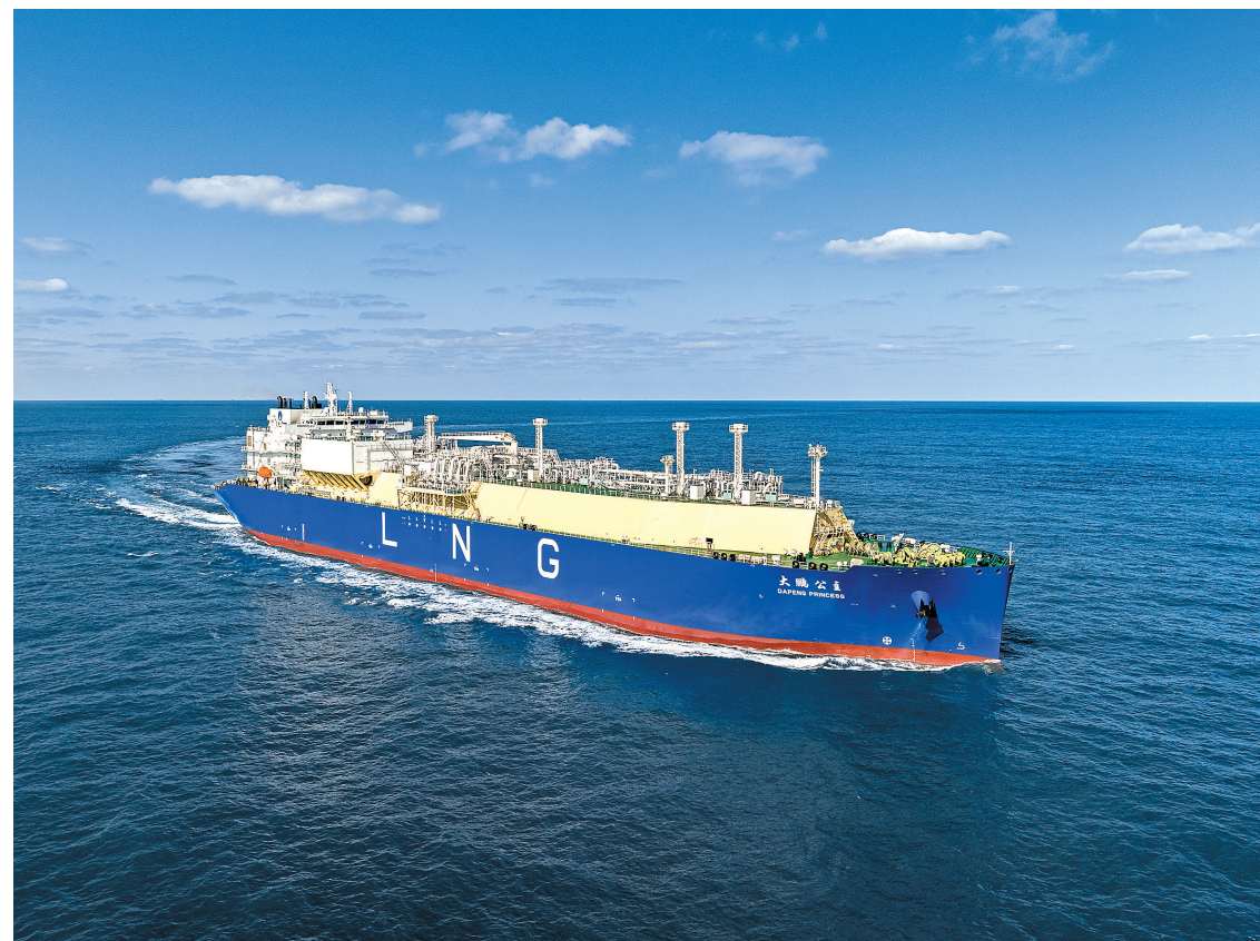
“大鹏公主”号LNG运输船

是全球最大的浅水航道第四代LNG船,可实现江海联运,将用于保障深圳城市天然气安全稳定供应