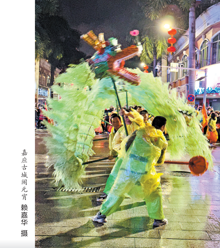
嘉应古城元宵