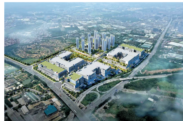
大族激光新总部基地项目效果图

羊城晚报讯 记者文聪报道:金太阳增资扩产项目……连日来,东莞市寮步镇、大岭山镇等多个镇街陆续有重大项目签约或动工,为全市经济社会高质量发展注入强劲动力。据东莞市发改局介绍,2023年东莞初步计划安排重大建设项目635个,总投资7607亿元。将通过加快推进“摘牌即动工”“完工即投产”等改革,全力提升重大项目落地效率。