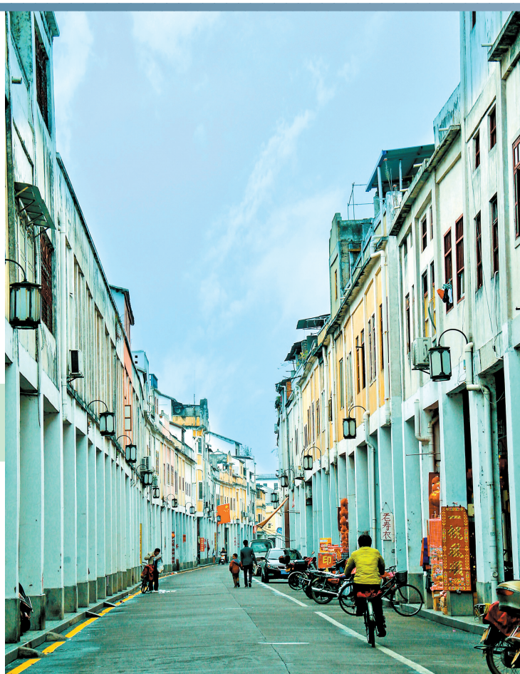
嘉应古城,独具韵味

梅江水岸,花灯倒影;嘉应古城,鱼龙戏舞。羊城晚报《大美岭南》第39站走进“满城梅花满城诗”的梅州,在这里,浓浓的客家味如春风拂面。南宋杨万里《明发梅州》诗中赞它:“市小山城寂,船稀野渡忙。金喧梅蕊日,玉冷草根霜。”郭沫若赋诗梅州:“灵禽闻有翎五彩,文物由来第一流。”“一城两坊”,是世界客都人文秀区的缩影,文物风流、人文荟萃。