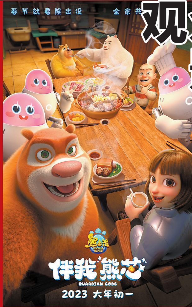
《熊出没·伴我“熊芯”》在今年春节档档期打破多项纪录