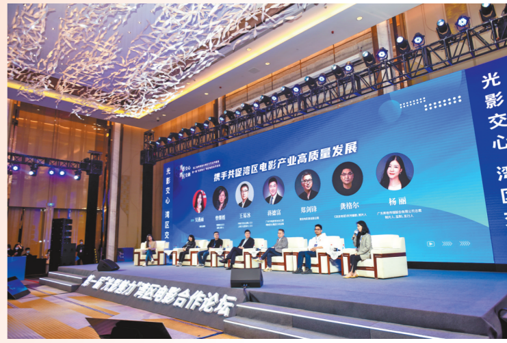
业内代表探讨湾区电影高质量发展路径