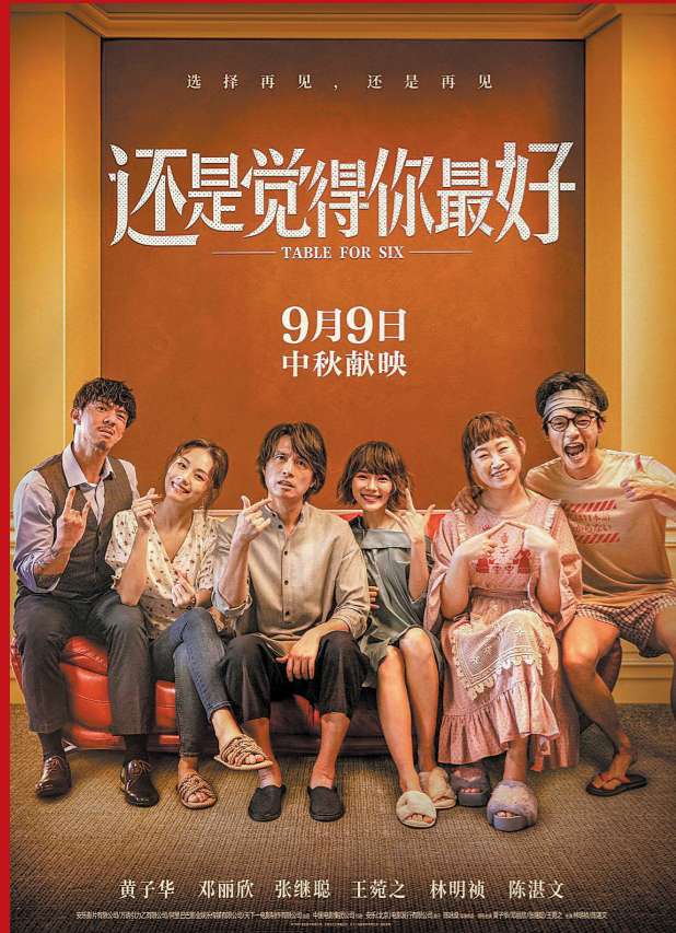
《还是觉得你最好》是港片在内地市场的一次成功探索