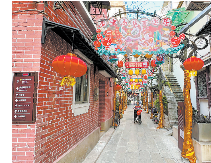
容貌品质社区海珠区南华西街龙武里社区

据悉,社区容貌品质全域提升行动,是广州市城管部门在2021年首创的一项系统改善社区人居环境的民生工程;“门前三包”则是由广州首创并在全国推行39年的城市管理制度。广州市城管部门相关负责人介绍,2022年广州共有1662个社区参与社区容貌品质全域提升行动。不少社区在提升容貌的同时,解决一系列城市管理问题。如3月1日作为现场会场的沙贝社区,在拆除违法建筑的同时将拆违地块改建为口袋公园,解决社区公共休憩空间问题;通过治理河涌,解决水体黑臭问题。天河区员村街锦屏社区和海珠区南华西街龙武里社区,通过容貌品质提升,让老社区公共空间得到焕新机会。从化区吕田镇吕田社区通过容貌品质提升,为社区增添小型足球场、全民健身设施,让居民有了体育锻炼场所。广州市城管部门根据