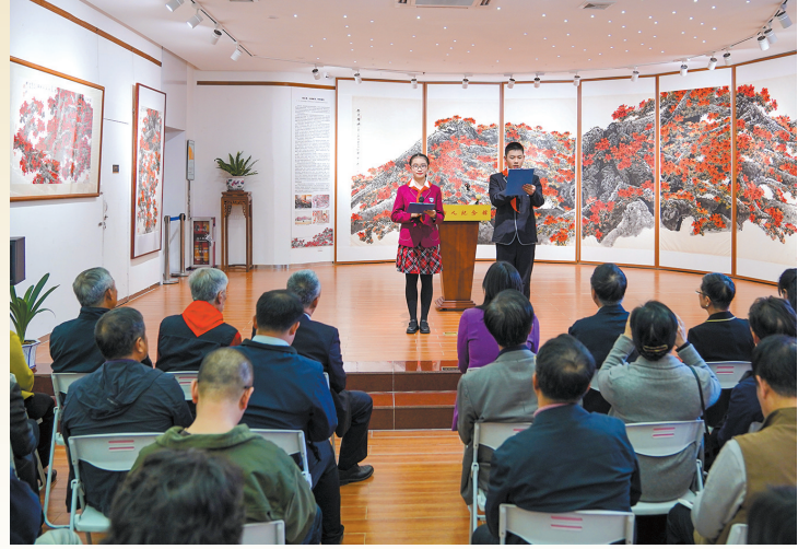
学生们朗诵画家陈永锵对红棉的感言