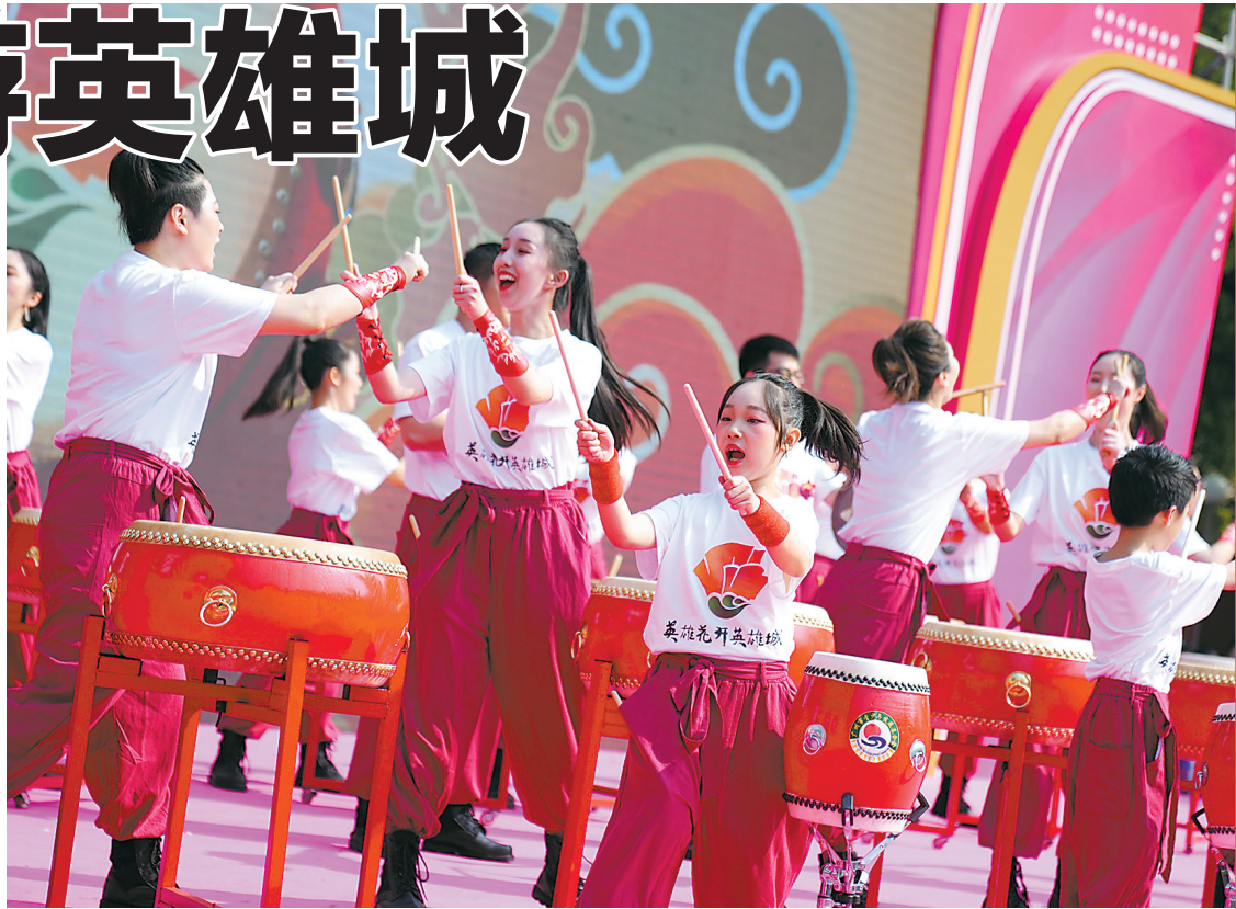
3月1日,“英雄花开英雄城”活动上,小朋友们带来了精彩的击鼓表演