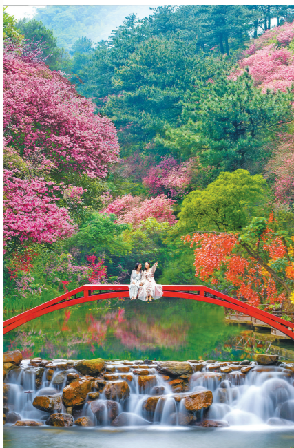
清远古龙峡赏花

内有超过1000株竹子,置身竹海深呼吸;入驻花都木莲庄酒店,泡着温泉,享受湖景,体验星空露营艺术旅居生活。