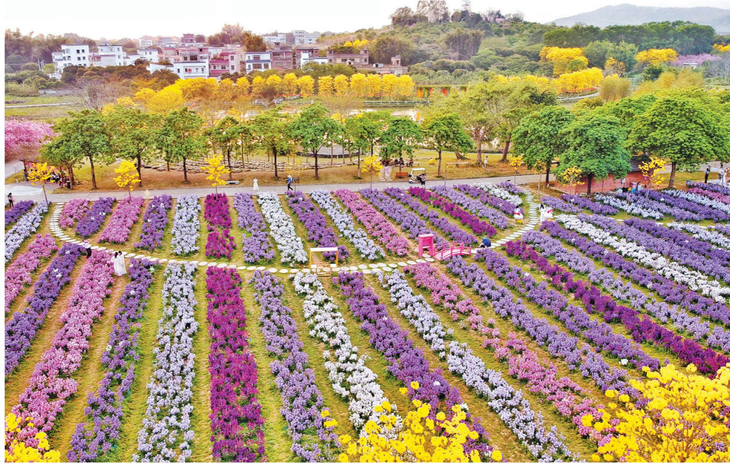
春天来临,从化樱花绽放