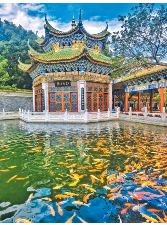
宝墨园春色

推开羊城古典画卷,走进岭南文化山水园林——宝墨园,去看美丽的樱花盛景;来到有“广州之肾”美誉的南沙湿地公园,可以坐着小船荡入红树林赏园;最后入住南沙花园酒店,感受私家园林式的花季美景。