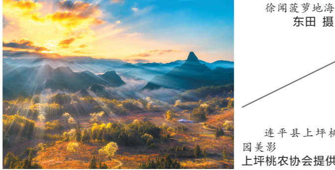
连平县上坪桃园美景

记者从本地旅行社了解到,2月以来,周边赏花游持续升温,该社推出的春季赏花线路受到欢迎,即将到来的“三八妇女节”将掀起短途游小高峰。特别是跟着《狂飙》游江门的热闹,结合3月芦荟花最佳赏花期,推出“双赏花海”特色线路,打卡台山的千亩金芦荟花海和火龙花花海。线路还打卡《狂飙》中有着原汁原味侨圩印记的梅家大院,有着骑楼建筑特色的台城历史文化街区等,让游客沉浸式体验江门的侨乡文化。