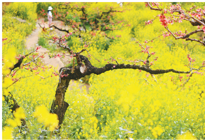
连平桃花与油菜花

粤北山区的桃花如期绽放,八方游客如约而至,漫山遍野粉黛点缀,一片热闹。据了解,广东省内种植的桃树主要分果桃和花桃两大类,珠三角以花桃为主,而粤北地区则大面积种植果桃,开花时间比珠三角更晚,最佳赏花期将持续至3月中旬。近年来,随着广东文旅融合不断深化,各地纷纷以桃花为媒,举办桃花盛会。