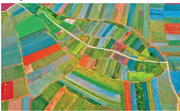
徐闻菠萝地海