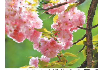
从化天适樱花园

天适樱花悠乐园拥有樱花林、水族馆、游乐园、动物园、室外游乐设施等娱乐项目,春回大地,这里樱花盛开;在稻喜湾温泉民宿,可看田园山色,享受返璞归真的温泉休闲体验;次日登白水寨旅游度假区天南第一梯,近距离感受白水仙瀑的震撼。