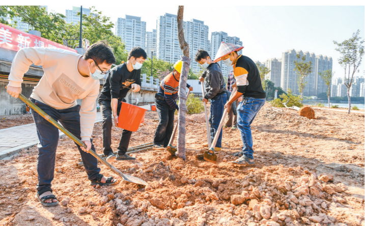
揭阳各地各部门组织开展义务植树活动

记者注意到,小程序还设置了“与您分享”的界面,通过这个板块向社会公众宣传义务植树