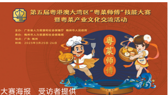
大赛海报

羊城晚报讯 记者从梅州市人力资源和社会保障局获悉,由广东省人力资源和社会保障厅、梅州市人民政府共同主办的第五届粤港澳大湾区“粤菜师傅”技能大赛暨粤菜产业文化交流活动将于3月25日至26日在梅州举行。(丘悦妮)