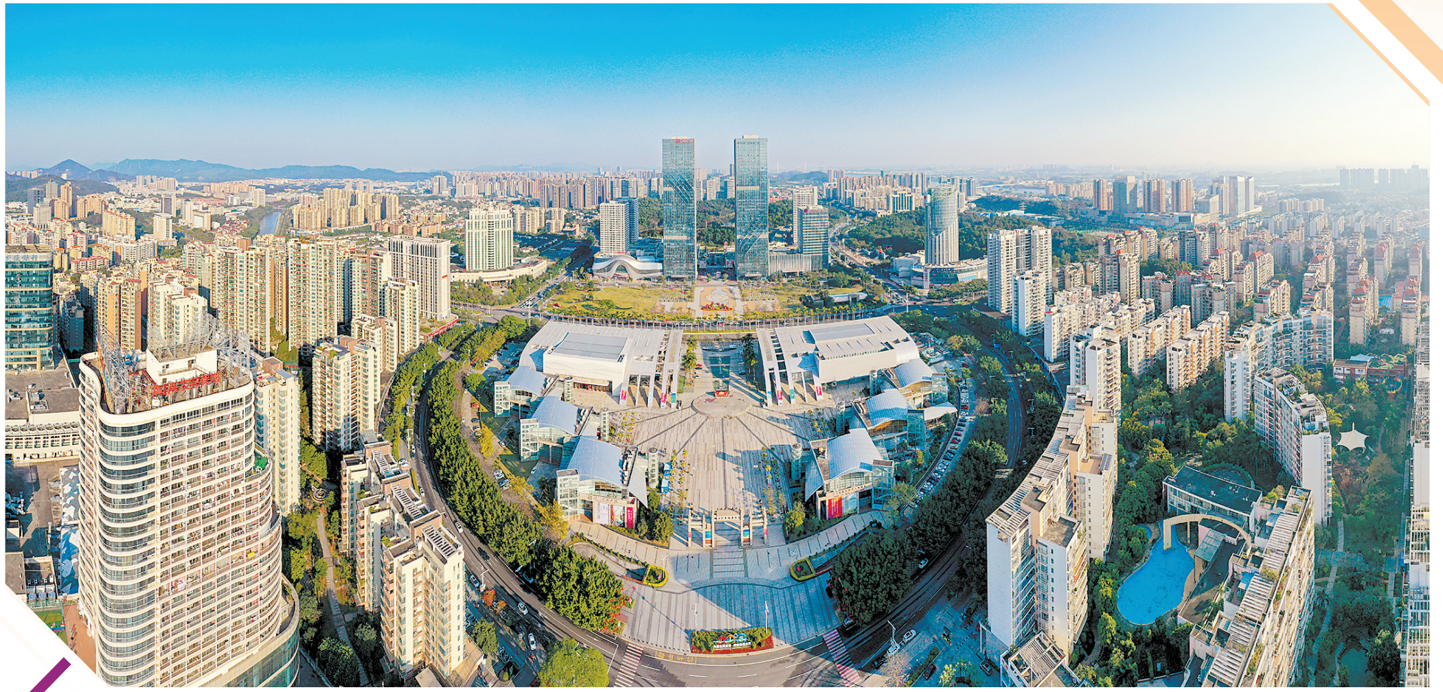
位于江门城市中心的五邑华侨广场

“红日初升，其道大光”。今年是中国近代著名启蒙思想家、政治活动家和学者梁启超先生诞辰150周年。在他的故乡江门，呈现一派欣欣向荣景象。