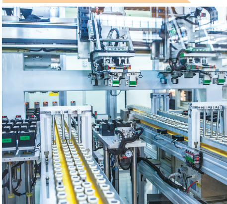
位于蓬江的海目星激光科技集团股份有限公司生产车间

这些定位和目标，紧跟党的二十大战略部署和省委、省政府工作要求，彰显格局担当、契合江门实际，站位高、视野宽、格局大，展现了推动江门塑造发展新形态的智慧和魄力。