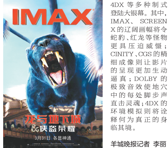
《龙与地下城：侠盗荣耀》IMAX版海报

在视听体验上，《龙与地下城：侠盗荣耀》不遗余力地追求沉浸感。据悉，影片将以IMAX、CINITY、CGS、DOLBY、SCREEN X、4DX等多种制式登陆大银幕。其中，IMAX、SCREEN X的辽阔画幅将令蛇豹、红龙等怪物更具压迫感；CINITY、CGS的精细成像则让影片呈现更加生动逼真；DOLBY的极致音效使地穴中的每处脚步直击灵魂；4DX的环境模拟则将诠释何为真正的身临其境。