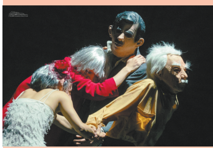
《面具2.0》关注老年人精神世界