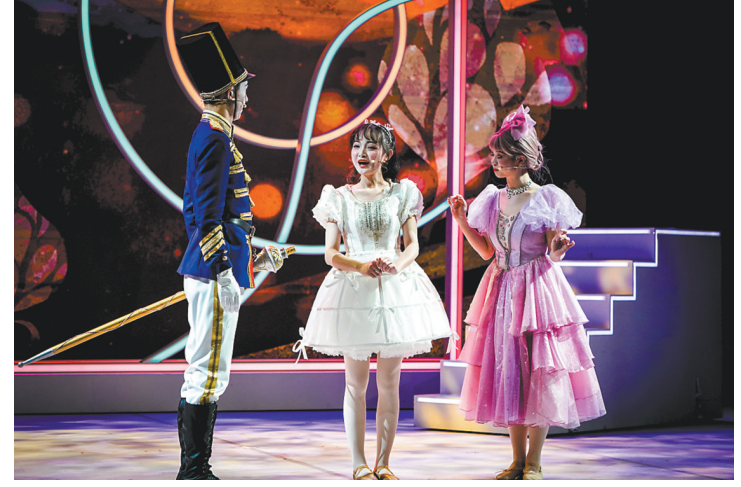
《胡桃夹子》改编自同名经典芭蕾舞剧