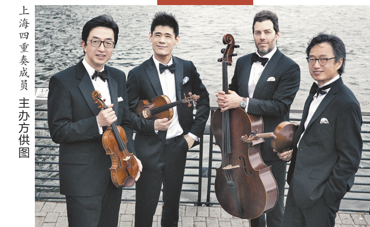
上海四重奏成员

2023年，星海音乐厅将迎来落成25周年纪念日。作为25周年演出季重磅呈现，星海音乐厅将特邀享誉世界乐坛40年的室内乐组合——上海四重奏(Shanghai Quartet)在星海音乐厅展开为期一周的驻场计划，用四场演出以及精彩多元的活动回馈乐迷。据悉，这也是上海四重奏在国内的首次“驻场”演出，曲目量多且融合了一系列活动，方便乐迷用一周的时间“入坑”室内乐。