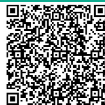
扫二维码了解更多

古人以鹤为瑞鸟，在广东，就有一座以鹤为名的城市，俯瞰全境，鹤山山势如白鹤亮翅。“赏新觅旧两相宜，情义鹤山世所知。画堂铁夫称巨擘，武尊梁赞是宗师。”江门鹤山的美，在于多元文化交融，在于青山绿水之间。羊城晚报《大美岭南》第44站走进江门鹤山，寻迹这座新旧相融、河畅水清、人杰地灵、充满动感和活力的城市。 鹤山，位于粤港澳大湾区的珠江西岸，距离广州一小时左右车程。沙坪河边醉人的花海令人流连忘返，竹树坡里美食长廊琳琅满目的美食让人垂涎欲滴，华侨城古劳水乡内打卡拍照的游人络绎不绝。作为江门代管的县级市，鹤山隶属珠江三角洲经济圈，得天独厚的区位优势，加上一代又一代的鹤山人抢抓机遇、埋头苦干，令这座城市旧貌换新颜。