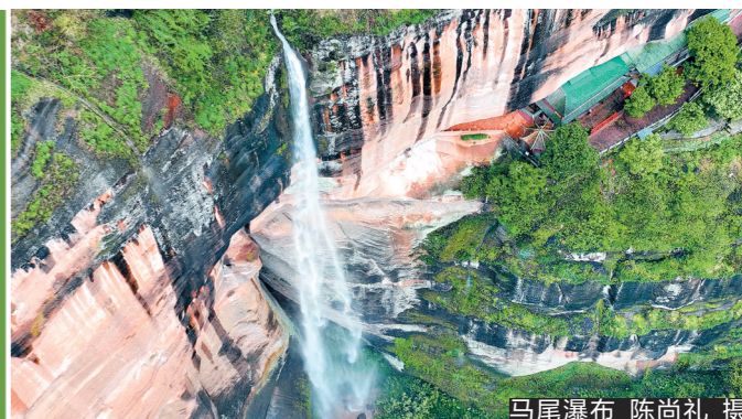
丹霞山再现马尾飞瀑

羊城晚报讯 记者张文、通讯员丹宣报道：受前段时间粤北地区持续降雨天气影响，丰沛的雨水在韶关丹霞山群峰顶部不断汇聚，丹霞山赤壁丹崖之上再现马尾瀑布这一特殊的自然奇观。 春雨初霁，走进丹霞山，站在长老峰下仰望，只见丹霞山群峰间，马尾瀑布飞流直下，如赤壁丹崖、青山翠竹间悬挂一匹灵动飘逸的白练。瀑布以丹霞赤壁为背景翩翩起舞，飘逸赤壁为幕，丹霞山之上，锦绣岩寺若隐若现，仿佛云中蓬莱仙境，让人产生无限遐思。上有水流急速跌落，中有水声铿锵作响，下有水汽袅袅升起，马尾瀑布与赤壁丹崖合成一幅“动态山水画”，奇美的景象也吸引了不少游客和摄影爱好者纷纷前来打卡。 记者在现场看到，前来观赏马尾飞瀑奇景的市民游客络绎不绝。游客们或手持相机、手机选择心仪角度，或操控无人机盘旋其间，试图记录下这让人心动的瞬间。韶关市民陈先生激动地表示，“这种景观当然是很难得的，所以一听说有瀑布我们马上就来了。” 据了解，丹霞山马尾瀑布位于游客中心往长老峰景区的中间地带，地处海螺峰和宝珠峰两座山峰交汇处，地形呈三面高、一面低的漏斗状。遇到持续强降雨天气，大量的雨水在此汇集，沿着赤壁丹崖倾泻而下，便会形成季节性的瀑布奇观。值得注意的是，瀑布奇观令人叹为观止，丹霞山风景区工作人员也提醒市民游客，雨天期间前往丹霞山旅游请提前留意景区信息通知，确保人身安全。