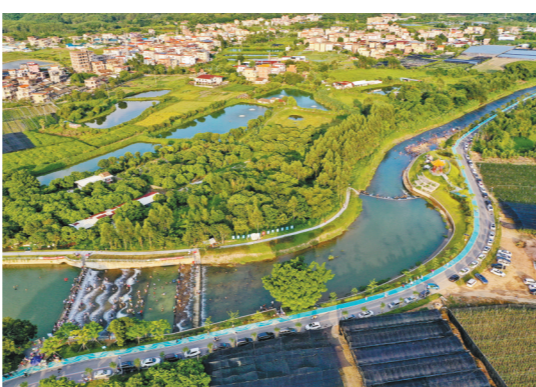
鹤城五星村

鹤山地如其名，“七山一水两分田”，俯瞰全境，山势如白鹤亮翅。大雁山、古劳茶山、鹤城昆仑山、双合云宿山、宅梧龙潭山等，得天独厚的区位优势，加上一代又一代的鹤山人抢抓机遇、埋头苦干，令这座城市旧貌换新颜。 青山倚碧水。西江蜿蜒流过鹤山，江畔万亩古劳水乡网纵横交错，小石桥连接阡陌，古榕树、水畔房前万顷菜鱼塘，如一块块翡翠镶嵌在西江河畔，倒映着蓝天白云，尽显岭南独特的水乡风情。 山水之间天地阔。满目苍翠，是那漫山遍野的参天林木，树荫之下，山花烂漫、茶芽青青。碧水如镜，河流、山涧、湿地，晕染一片湿润。划破水面，泛起波澜，