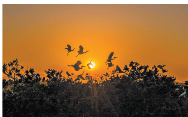
万物精灵

古人以鹤为瑞鸟，在广东，就有一座以鹤为名的城市，俯瞰全境，鹤山山势如白鹤亮翅。“赏新觅旧两相宜，情义鹤山世所知。画堂铁夫称巨擘，武尊梁赞是宗师。”江门鹤山的美，在于多元文化交融，在于青山绿水之间。羊城晚报《大美岭南》第44站走进江门鹤山，寻迹这座新旧相融、河畅水清、人杰地灵、充满动感和活力的城市。 鹤山，位于粤港澳大湾区的珠江西岸，距离广州一小时左右车程。沙坪河边醉人的花海令人流连忘返，竹树坡里美食长廊琳琅满目的美食让人垂涎欲滴，华侨城古劳水乡内打卡拍照的游人络绎不绝。作为江门代管的县级市，鹤山隶属珠江三角洲经济圈，得天独厚的区位优势，加上一代又一代的鹤山人抢抓机遇、埋头苦干，令这座城市旧貌换新颜。