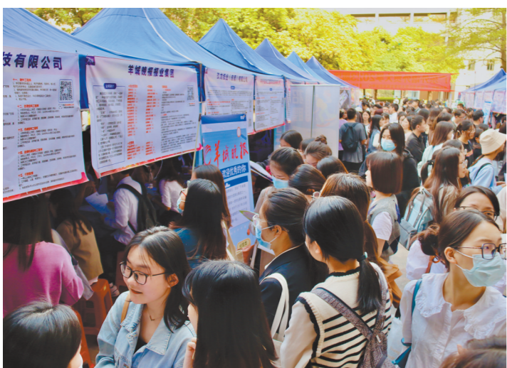
羊城晚报集团招聘现场受访者供图

阳春三月，春暖花开。近日，各大高校把毕业生就业工作摆在突出位置，纷纷开展多场春季校园招聘，不断拓展岗位资源，全力促进毕业生高质量充分就业，为用人单位与毕业生搭建双向选择的沟通交流平台。