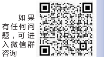
如果有任何问题，可进入微信群咨询