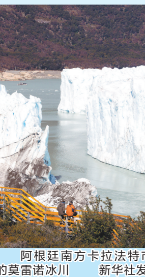
阿根廷南方卡拉法特市的莫雷诺冰川

记者了解到,目前“五一”假期出境游产品预订已经提前进入高峰,截至3月,预订量同比增长近17倍。出境游价格“水涨船高”,机票待航班换季后有望进一步降低,但整体价格下降速度难言乐观,专家建议可错峰出游。