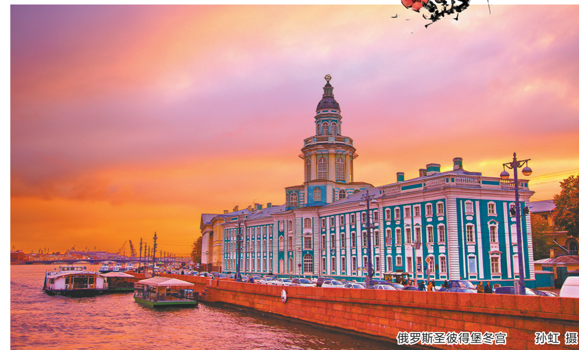
俄罗斯圣彼得堡冬宫

业内人士还介绍,目前60个试点国家名单中,有23个国家向中国游客提供签证便利,13个国家支持中国游客落地或电子签证。