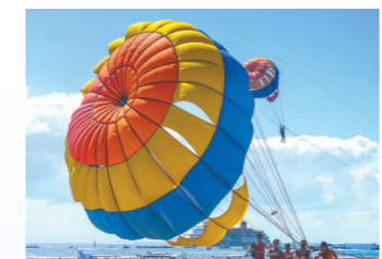
印尼巴厘岛多姿多彩的活动