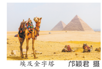
埃及金字塔

“五一”出境自由热热度也持续上涨。马蜂窝数据显示,近期马蜂窝站内“五一出境游”相关热度上涨超过110%。泰国、马来西亚、印度尼西亚和西班牙是目前“五一”假期订单量较高的目的地,近一周旅游热度上涨均超过100%。爱彼迎的数据显示,2023年春季(在2023年4月1日-5月15日期间入住)欧洲房源搜索热度已经反超疫情前的2019年同期水平,近四成用户搜索了欧洲住宿。