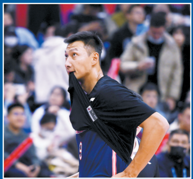
广东队名将易建联