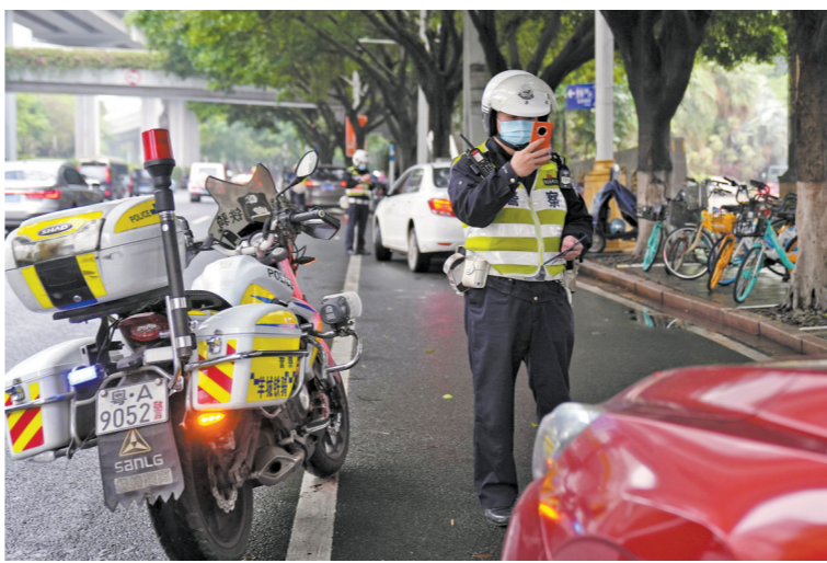
越秀交警大队在东风东路对违停车辆进行执法 羊城晚报记者 周巍 通讯员 交宣

怎样的路段会被设置为机动车违停严管路段?严管路段又将如何管理?广州市公安局交警支队秩序设施大队尹警官告诉记者,违停严管路段主要针对通行能力欠佳的道路或者违法停车行为较为突出的路段进行设置,例如学校、医院、批发市场周边等路段。在严管路段上的违法停车行为,执法民警不会进行违停告知,会直接采取处罚措施。