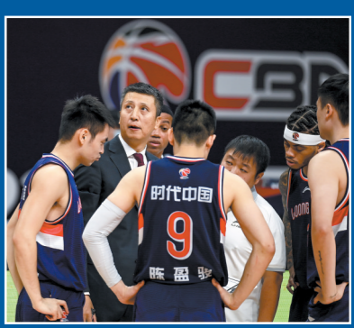
广州队赛季季后赛