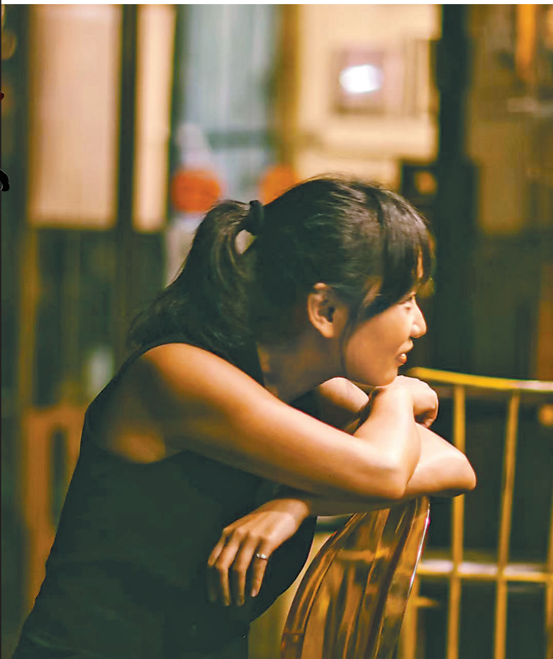
暂时离开令人眼花缭乱