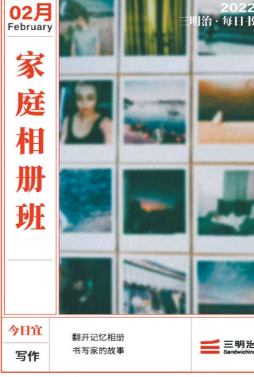
“每日书”写作社群主理班

写作这门古老的技艺,在数字化、网络化、智能化快速演进的当代,呈现出别样的意义。这个自发的写作社群得到了来自专家们的祝福。