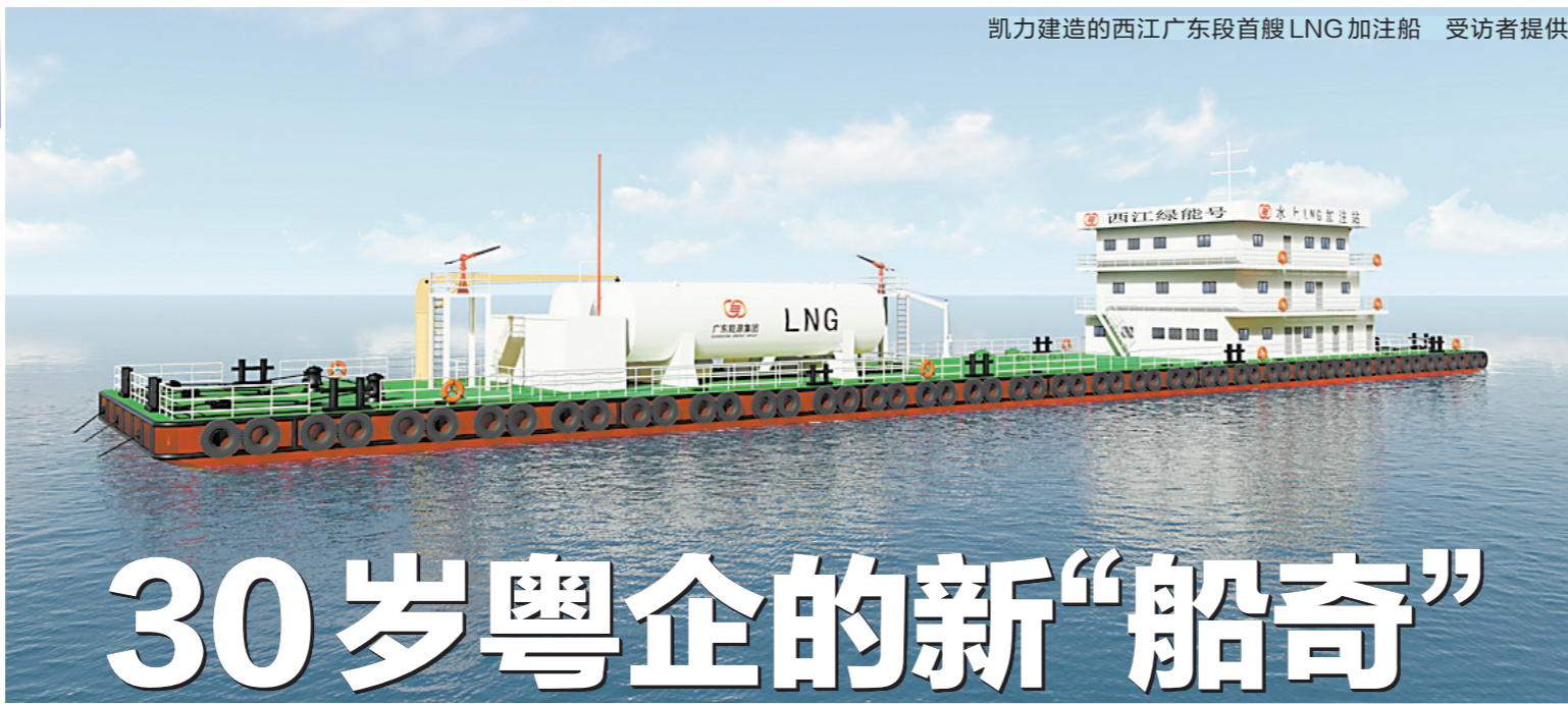
凯力建造的西江广东段首艘LNG加注船