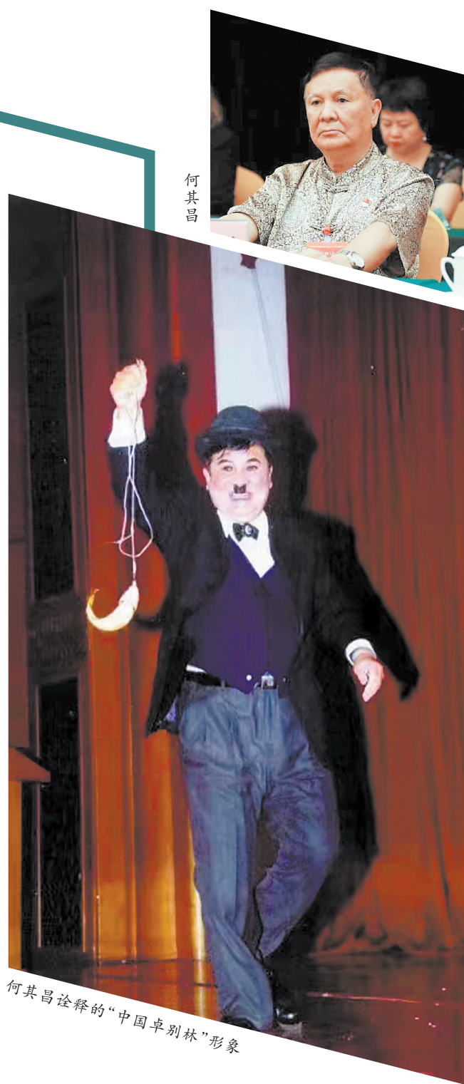
何其昌诠释的“中国卓别林”形象