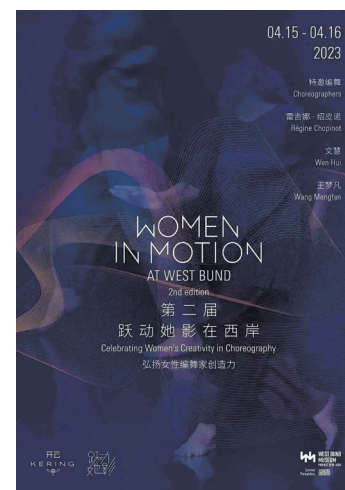
第二届“跃动她影在西岸”当代舞蹈节海报

日前发布的中法联合声明提到,将支持上海西岸美术馆与蓬皮杜艺术中心在两国合作举办高水平活动。4月15日至16日,第二届“跃动她影在西岸”当代舞蹈节将在上海举行,由上海西岸美术馆、蓬皮杜艺术中心五年展陈合作项目携手开云集团打造。届时中法两国编舞艺术菁英将通过舞台表演、影像、论坛和工作坊等形式,呈现一场跨越时空、文化与代际的艺术对话。 首届“跃动她影在西岸”当代舞蹈节曾在2021年大放异彩,收获了来自文化艺术界及观众的广泛好评,第二届活动将再度推出精彩纷呈的内容。 法国著名编舞家雷吉娜·绍皮诺与中国著名编舞家文慧首次联袂创作,推出舞蹈影像《不止于舞蹈》,向“超黑画”大师、艺术巨擘皮埃尔·苏拉致敬。文慧还将重排其初创于1996年的作品《裙子》。新一代备受关注的舞蹈与剧场创作者王梦凡则为本届舞蹈节量身创作新作《叙事喷泉》。多场围绕女性当代舞蹈艺术创作的影像放映、对话、大师班等活动都将在本届“跃动她影在西岸”上呈现。