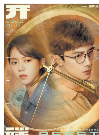
热播剧《开端》改编自晋江文学城同名小说

4月7日至8日,2023年全国网络文学工作会议在上海举行。中国作协网络文学中心在会上发布的《2022中国网络文学蓝皮书》(以下简称《蓝皮书》)显示,2022年网络文学新增作品300多万部,主要网络文学平台营收规模超230亿元,网络文学IP处于文化产业龙头地位。 《蓝皮书》数据显示,2022年度全国重点网络文学网站新增注册作者260多万人,同比增长13%;年度新增签约作者17万人,同比增长12%。网文及其他重要网站数据显示,活跃的头部分作者“90后”占比超过80%。