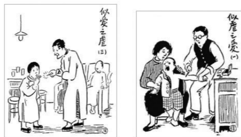
漫画：似爱之虚与似虚之爱

细品丰子恺的两幅漫画，根据要求写作。假如你的母校春风中学，初一年级要召开以“家庭教育”为主题的家长会，拟请高考结束后的你在初一年级全体家长会上发言。请根据漫画的内容，并结合自己的成长经历，写一篇发言稿。要求：选好角度，确定立意，明确问题，自拟标题，不要套作，不得抄袭，不得泄露个人信息；不少于800字。