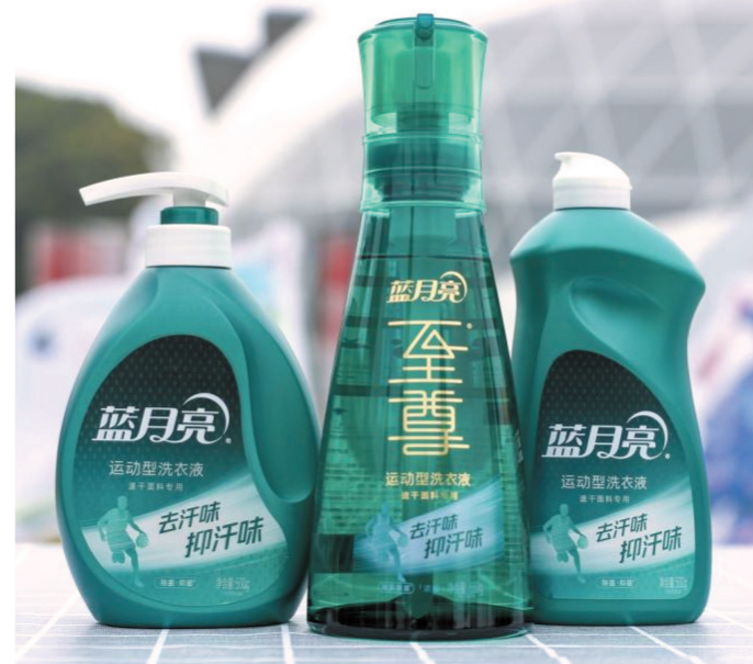
全渠道建设 持续缩短消费者触达半径

日前，普华永道发布的《2022年全球消费者洞察脉搏调查》报告显示，81%的受访者表示他们在过去6个月内会通过至少3-4个渠道购物。绝大多数的消费者会依照他们的需求，在购物旅程中反复在线上、线下切换。