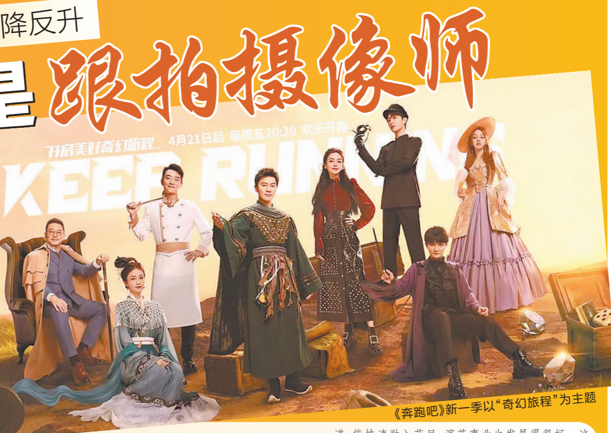
《奔跑吧》新一季以“奇幻旅程”为主题