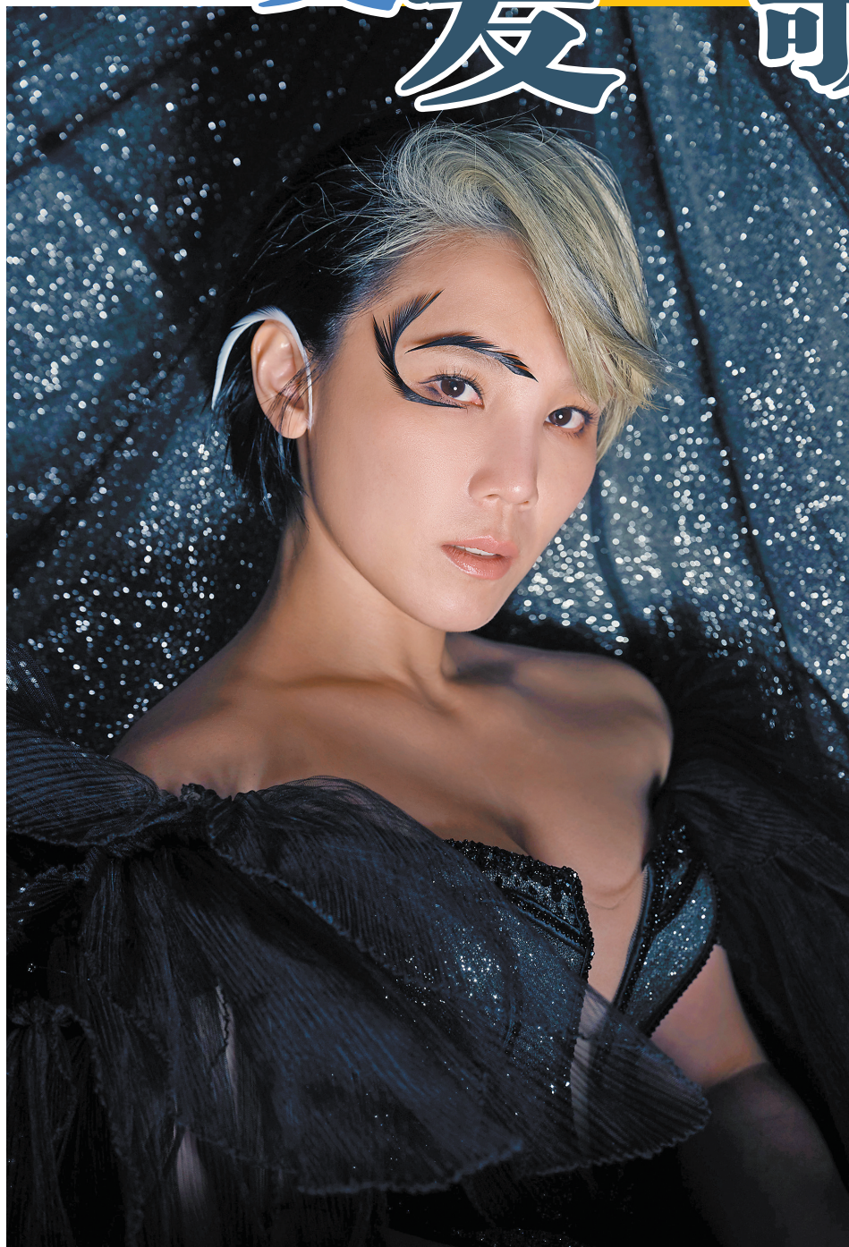
时隔六年,李佳薇首次回到家乡广东开唱