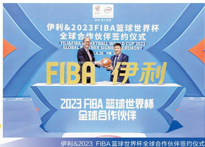
伊利&2023 FIBA 篮球世界杯全球合作伙伴签约仪式