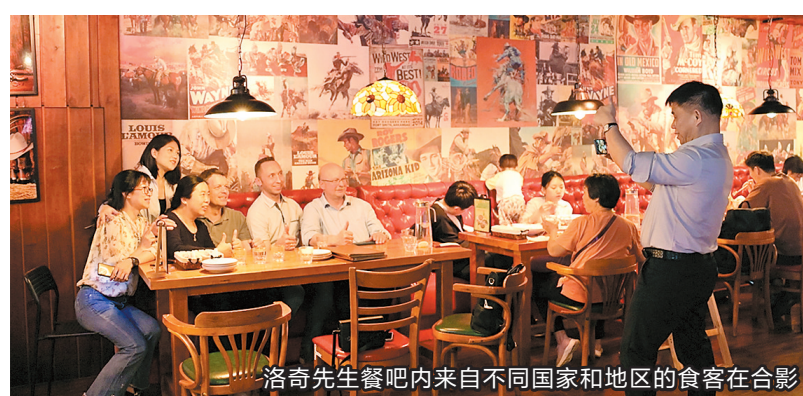
洛奇先生餐吧内来自不同国家和地区的食客在合影