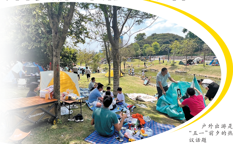
户外出行是“五一”前夕的热议话题

“五一”假期还未开启,消费市场就已经被浓厚的假期氛围点燃。多个在线旅游平台发布五一假期预测报告,距离假期不到10天,“五一”国内酒店、景区门票、机票订单量均反超2019年水平。同时,在线上消费平台,户外出行,酒水食品、春夏服饰等品类也迎来销量爆发,记者了解到,京东、唯品会等电商平台,针对“五一”出行季,也推出了相应的促销活动来适应人们在节日的购物需要。