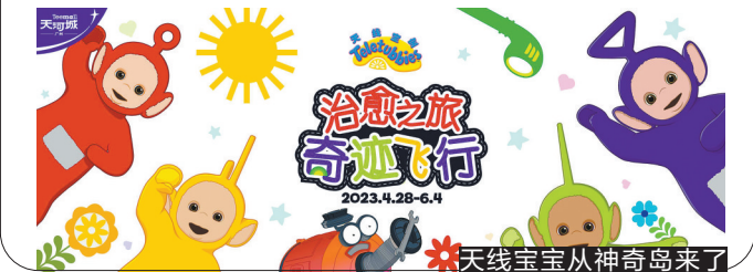
天线宝宝从神奇岛来了

在天线宝宝和大家见面的这些日子里,广州天河城也将开展多场线下活动哦,在五一劳动节、母亲节、儿童节期间推出团购代金券、消费满额赠礼、免费停车等优惠活动。