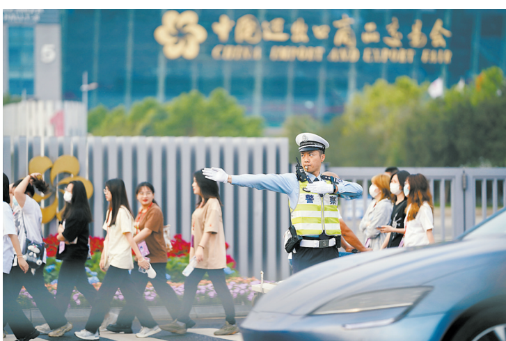
广州警方抽调大量警力保障广交会交通顺畅