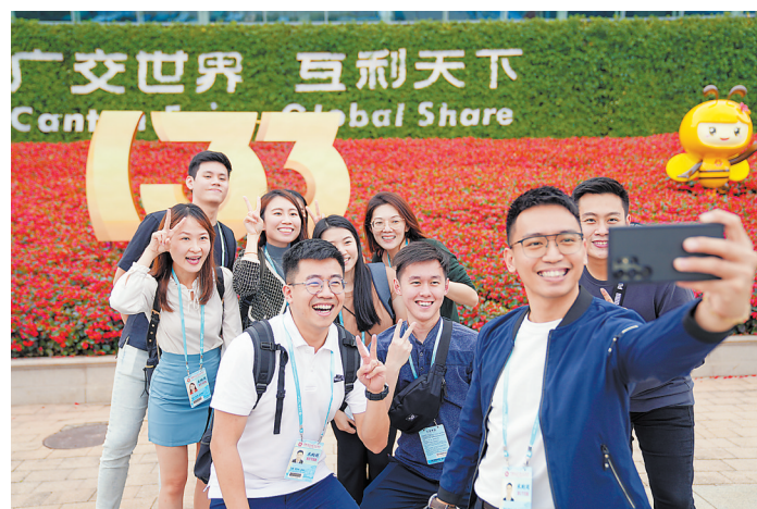
本届广交会已成网红打卡地