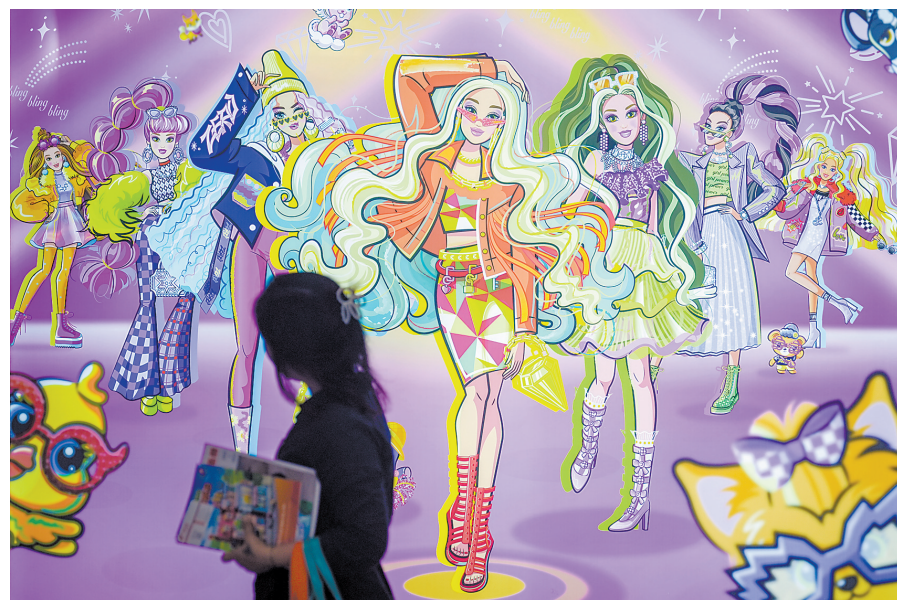
在广交会玩具展区,一家销售芭比娃娃的参展商在展位外挂出了大幅海报