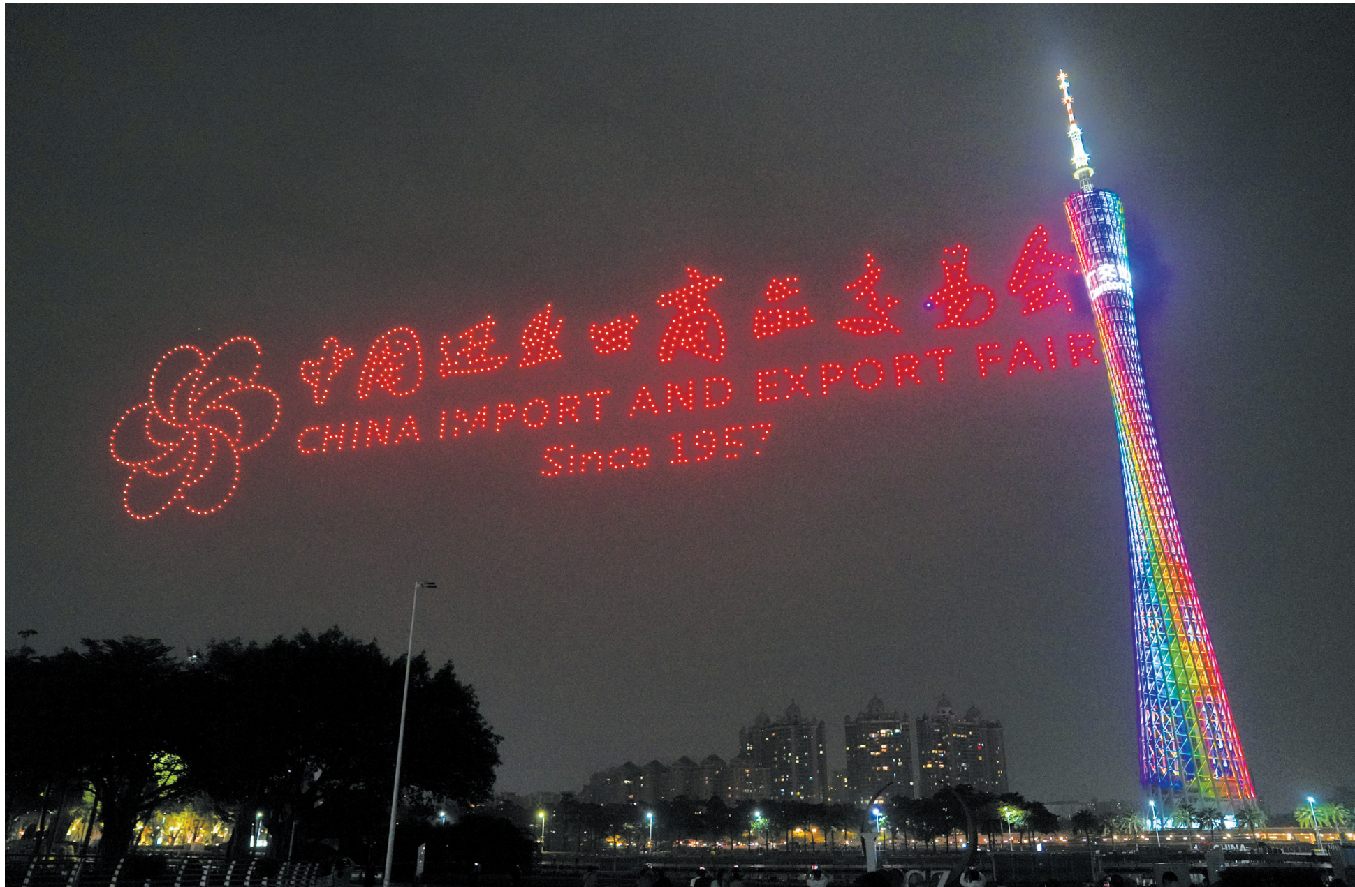
在第133届中国进出口商品交易会(广交会)开幕前夕,广交会无人机飞行表演在广州海心沙精彩上演。1000架无人机缓缓升空,在空中变幻出“第133届广交会欢迎您”“重聚盛大广交 共享全球商机”等相关字样以及广交会吉祥物、醒狮等图案