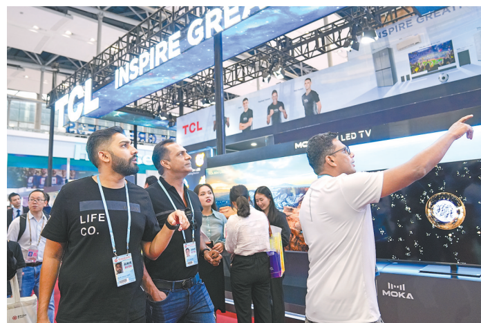
采购商在广交会上参观