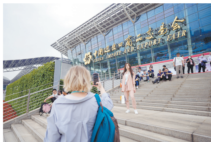
参展人员在展馆外留影