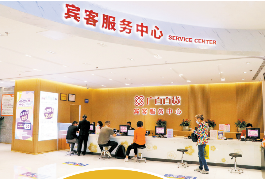
广百北京路店的退税服务专区

据广百股份相关负责人介绍，广交会期间，广百门店还全面升级“广式服务”措施，推出“多语种服务、专属客服导购、城市资讯导览、外宾特惠尊享、顺丰同城配送、广式礼遇相赠”等贴心服务，并联动岭南商旅旗下中国大酒店、广州宾馆等广交会接待酒店跨界互融，推出住客专属礼遇，送上“广式服务”、岭南印象的新体验。