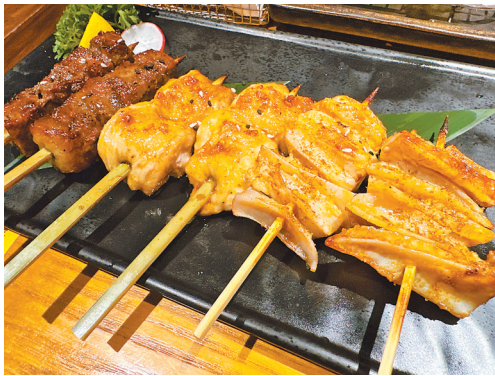
烧烤店新鲜出炉的烤串

“既满足用户需求，又促进商户增收，还提振经济和消费。”美团外卖相关负责人表示，“希望通过消费券形式，促进消费提振，助力本地经济发展，同时也希望给本地居民带来更优惠、更便捷的购物体验。”