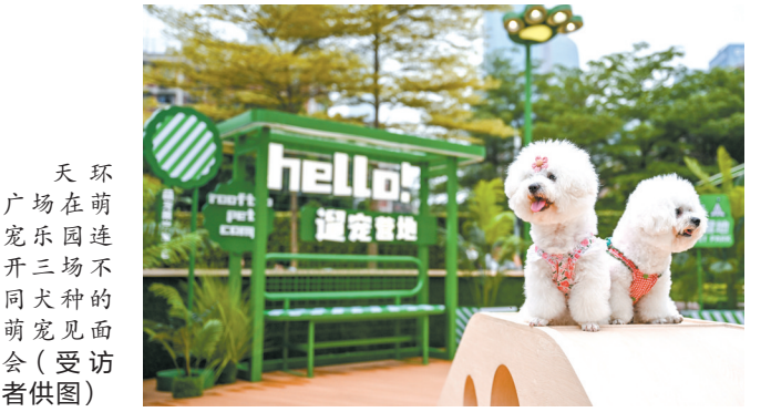
天环广场在萌宠乐园连开三场不同天种的萌宠见面会

除了新潮玩法，“夜游经济”也成为今年“五一”消费的新增长点。如年轻人聚集的天环广场，天台花园市集汇聚了上百个潮流摊位与音乐演出，点亮城市夜生活，特别是天台live show音乐演出，营造年轻人最爱的节日惬意氛围。各种演艺项目、展览等丰富多彩的夜间商业形态，延长了消费链条，助推夜间消费热度不断攀升。