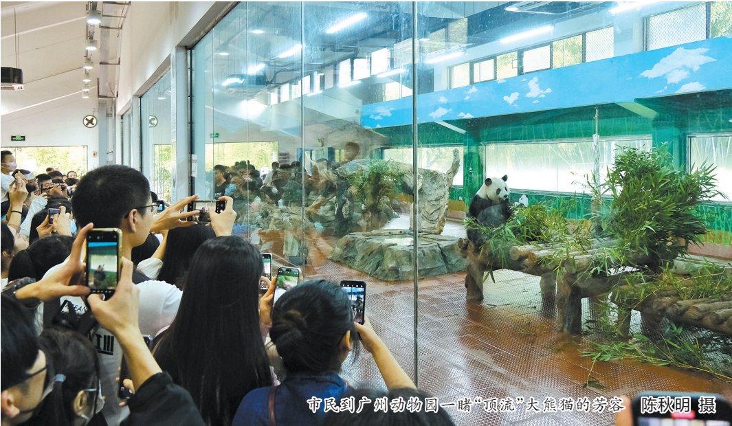
市民到广州动物园一睹“顶流”大熊猫的风采