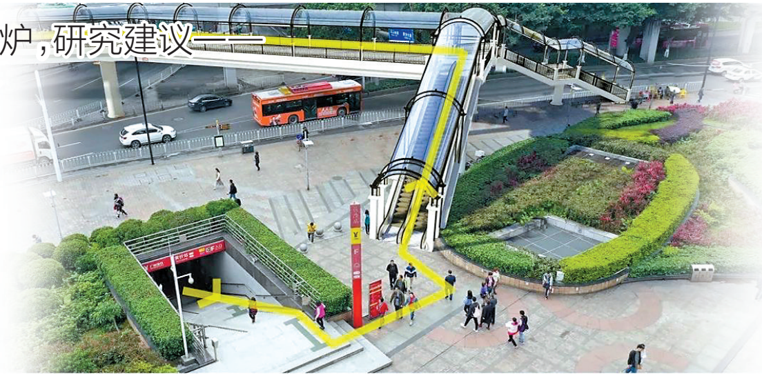
过街天桥优化意向图

路内外慢行空间融合示范区: 从“完整街道”的角度,对道路红线内的非机动车道、人行道等空间与道路红线外的建筑退距、路侧绿带等空间进行功能融合规划,将慢行交通设施、城市家具、城市配套设施等进行统一布局,推动路内外慢行空间融合使用。