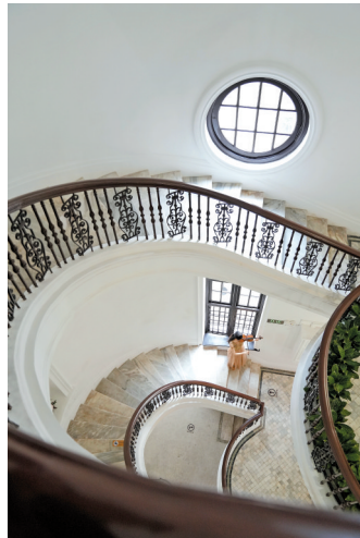
螺旋式楼梯被誉为“最美旋转楼梯”

荔湾博物馆工作人员徐晶介绍:“除了有实物的展品,还打造了适合打卡的沉浸式体验。有很多建筑外墙是圆柱形,我们依托建筑结构的特点做了有意思