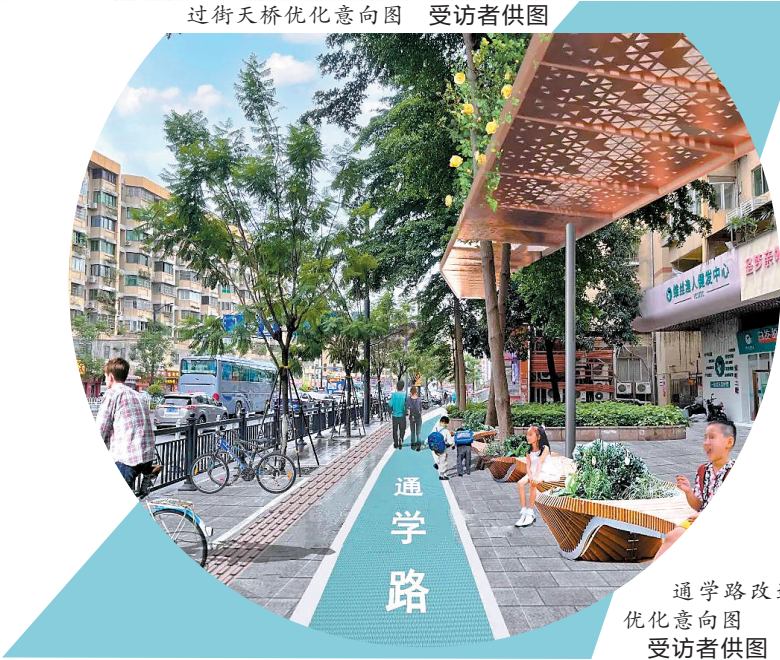
通学路改造优化意向图