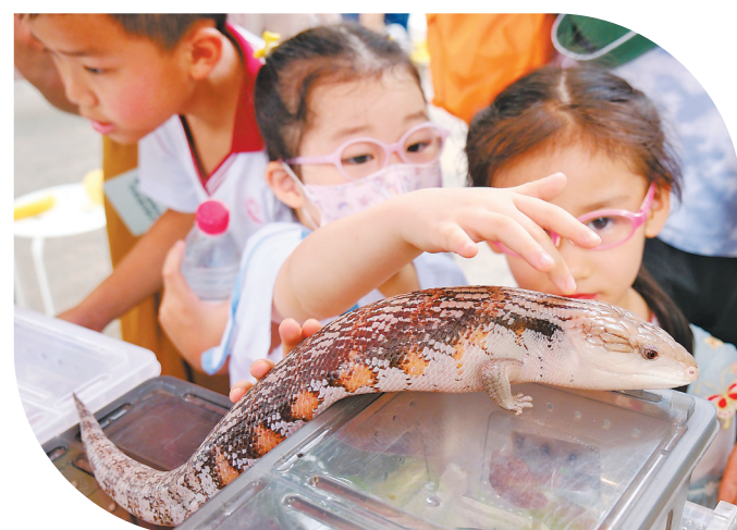
孩子们在科普嘉年华摊位与小蜥蜴互动

保护生物多样性，日常生活中怎么做？广州动物园科普教育部部长黄志宏表示：“可以从我们身边的小事做起，保护野生动物更要保护其栖息环境，如果栖息环境被破坏，生物多样性就难以维系。比如，我们要爱护身边的植物、绿化、水源，保护野生动物栖息的绿地。”