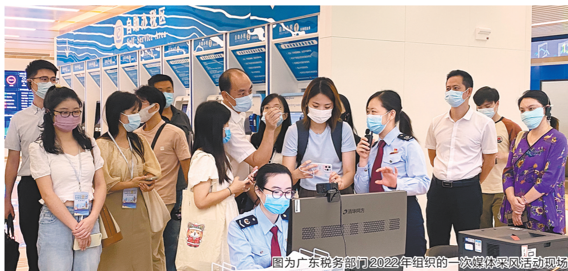
图为广东税务部门2022年组织的一次媒体采风活动现场

好新闻里看税收。一一翻阅这些获奖作品,“税收现代化”“组合式税费支持政策”“服务大局”“便民办税”“跨境办税”等关键词频频出现。透过五个新闻关键词,看广东税务如何锚定高质量发展首要任务,聚焦税务主责主业积极作为。