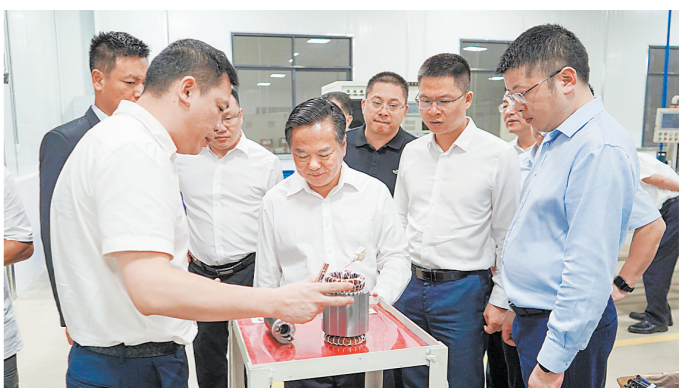
梅县区主要领导率队到广西考察招商

各项惠企政策，增强企业发展信心。抓好审批服务。梅县区创新项目前期审批“一次性梳理、清单式交办、并联式推进、专班式服务”机制，实行区领导挂帅招商项目负责制，解决项目审批、要素保障等问题。该区还出台涉企政务服务帮办代办服务制度，并在区政务服务中心成立梅县区审批代办服务中心窗口。企业在办理涉企事项时，可通过审批代办中心与相关职能部门协调，让行政审批更灵活高效。