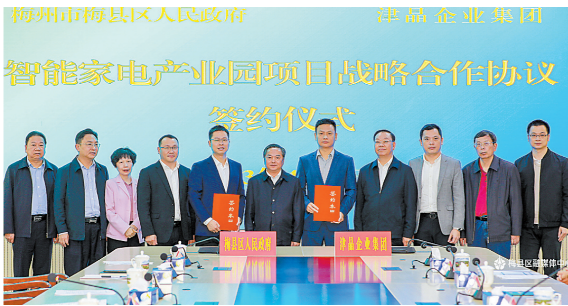
总投资31.6亿元的智能家电产业园系列项目签约