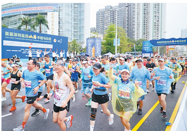
盐田举办首届山海马拉松