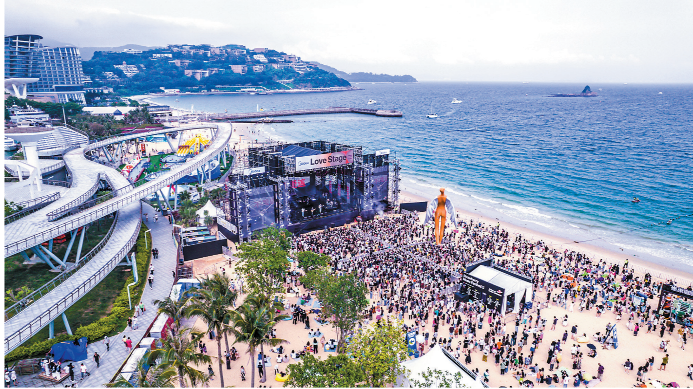
草莓音乐节现场

“抓好旅游、消费、物流‘三件大事’,为深圳高质量发展贡献盐田动能。”近年来,盐田区大力实施“产业兴盐”“创新驱动”,全力打造全球海洋中心城市核心区和沙头角深港国际消费合作区,重点抓好旅游、消费、物流“三件大事”,加快构建以海洋经济、现代时尚、生命健康等战略性新兴产业为主体的现代产业体系。而今,“三件大事”风生水起,城区发展生机勃勃,加快高质量全面建成宜居宜游的现代化国际化创新性滨海城区。