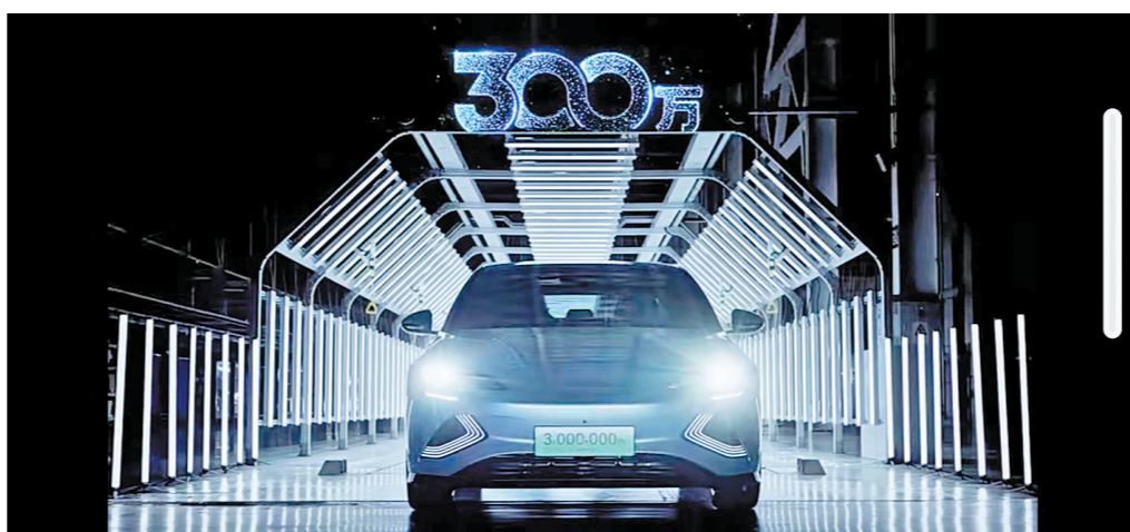
比亚迪在新能源赛道上正上演全新“加速度”

比亚迪坚持“技术为王，创新为本”的发展理念，以20多年久久为功的坚持和实践，终于在红海中杀出一片蓝海，迎来了从技术、产品到市场的全面爆发，实现全面“领跑”。