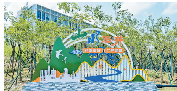
“山水石井、科教都会、门户新城”景观小品

城市管理一头连着城市发展，一头连着千家万户。石井街道将坚决打好市容环境综合指数提升持久战、坚决打好全国文明城市巩固提升持久战，大力破解城市管理中的难点、堵点、痛点，全力提升城市综合治理能力，不断以精细化管理焕发城市之美，加快城市品质提升，改善人居环境，让景观变得更优美，让城市更加宜居宜业，让老百姓的生活更美好。