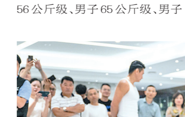
发布会现场的表演赛

拉根增城走向世界,打造增城体育新名片。据主办方介绍,本场赛事融对抗性、挑战性、观赏性于一体,无论是参赛选手、选手检查员、裁判员还是解说员阵容都达到了国内综合格斗赛的顶级水准,希望以竞技运动为载体,在文化、竞技、武术等诸多领域引起社会关注,促进广州全民健身。届时,中国香港著名演员、电视剧《陈真》中主角“陈真”扮演者梁小龙将作为特邀嘉宾的空降赛场。