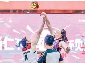
比赛中的激烈对抗场面