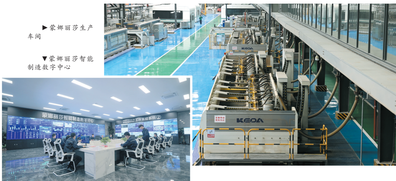
蒙娜丽莎生产车间

经过一番认真的调研和思考,蒙娜丽莎内部最终达成了共识,如果不走数字化之路,未来将面临被淘汰的危机。