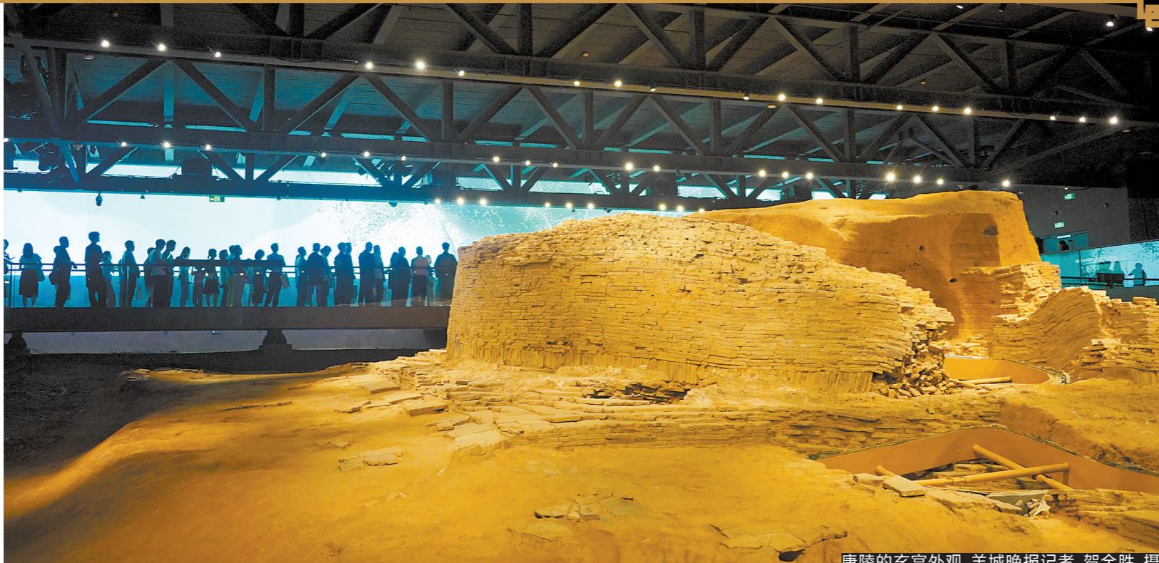
康陵的玄宫外观

1081年前，南汉开国皇帝、高祖刘岩驾崩于王宫内，随后其子刘玢主持将他迁葬位于广州小谷围岛上的康陵。20年前，广州市文物考古研究所抢救性考古发掘中，发现了五代南汉德陵(刘岩兄刘隐之墓)和康陵。 10日，南汉康陵遗址全面完成本体保护与展示利用工程，正式向公众开放。广州这座千年帝陵的真容，向人们慢慢揭开。