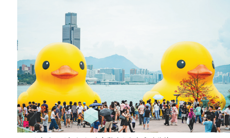
天空时雨下起小雨，没有影响人们打卡的热情

羊城晚报记者 王漫琪报道:10日起，为期两周的大型海上公共艺术展《橡皮鸭二重奏》在香港维多利亚港添马公园海面正式展出。这是该主题展的全球首站，也是巨型橡皮鸭(又称“大黄鸭”)时隔十年再访香港。更让人惊喜的是:大黄鸭此次还带来“伙伴”，两只大黄鸭齐齐和市民游客见面。 许多香港市民对10年前大黄鸭首次来港时轰动全城的场面记忆犹新:当年大黄鸭在香港逗留一个月，有将近800万人“打卡”，和可爱呆萌的大黄鸭合影留念，连刘德华等艺人都是它的粉丝，可谓妥妥的顶流。 时隔十年，这次重返香港的大黄鸭“长高”了，从16.5米升级到18米，为目前全球最高的橡皮鸭。更吸引眼球的是，大黄鸭还带着同伴回来，两只一模一样的大黄鸭同时出现在维多利亚港中环海面，“打仔上”(粤语，成双成对之意)，带给大家双倍的欢乐。 不过，开展首日就发生了一个意外的“插曲”:当天下午近2时许，一只大黄鸭突然“漏气”迅速消瘪，只剩一张橡皮漂浮海面。据主办方解释，现场人员例行检查时发现因天气炎热导致橡皮鸭气压上升而膨胀，为避免风险决定即时放气，运走检修。只留下另一只大黄鸭继续展出。昨晚，在场围观的市民表示