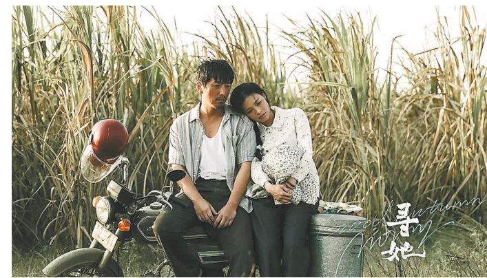
白客与舒淇在片中扮演一对夫妻