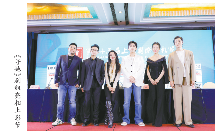
《寻她》剧组亮相电影节

但你如果说松弛感……毕竟都干了这么久了，我觉得就是经验而已。比如走红毯，不就是走红毯吗，不就是拍拍照片吗？熟能生巧嘛。