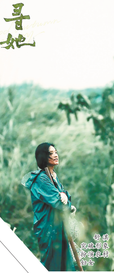
舒淇突破形象饰演农村妇女

舒淇：最大的挑战是我要演一个跟我完全两样的人——我觉得我本人还挺时尚的，我不知道自己能不能演出陈凤娣的感觉。直到有一天导演给我看了一个片子，里面也是一个卖甘蔗的人，他梳着油头，特别帅气和利落，跟我想象中卖甘蔗的人很不一样。后来我又接触了很多农村的人，发现他们跟城市的关系都很紧密。我觉得这个角色不是我原本想象的那个样子，慢慢就打消了很多顾虑。