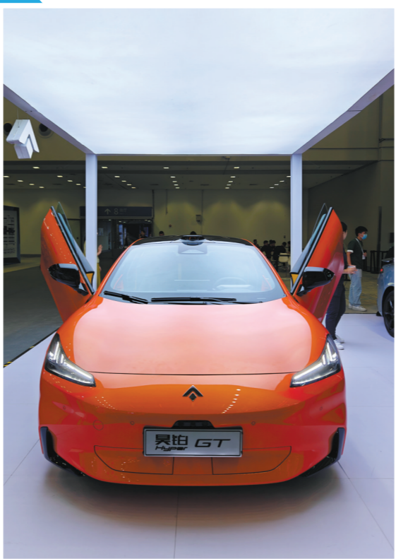
昊铂等十多个新品牌完成在大湾区车展首秀

此次深圳各级政府还专项制定了购车补贴,如:南山区1.5亿元、宝安区5000万元、龙华区5000万元、福田区3000万元、光明区两轮补贴总额6000万元、龙岗4500万元等。若市民在车展购车,不算车企各项优惠,仅从区政府领取的综合最高补贴额度就可达3.3万元。各项购车补贴,有效刺激了大湾区车市动能。