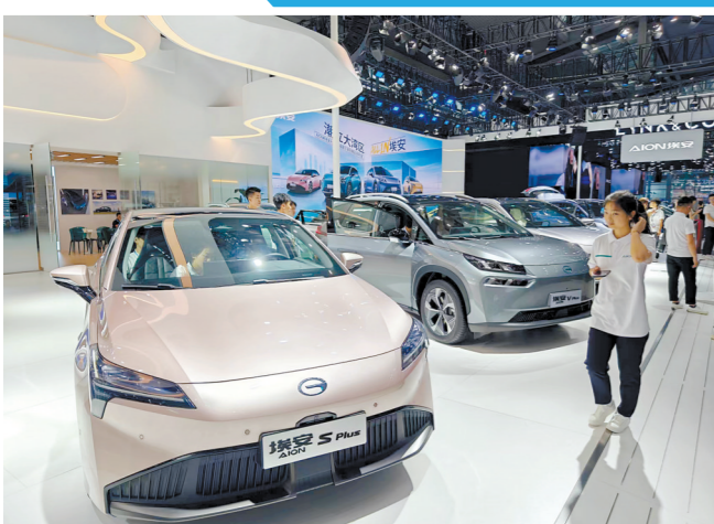
广汽埃安在车展上带来AION家族车型

近日,2023(第二十七届)粤港澳大湾区车展暨新能源汽车博览会(以下简称“粤港澳大湾区车展”)在深圳会展中心(福田)正式开幕。作为粤港澳大湾区汽车产业交流盛会,本届展会以“先行向未来”为主题,吸引了约200家汽车整车、零部件及技术服务、学术研发等品牌企业参与。