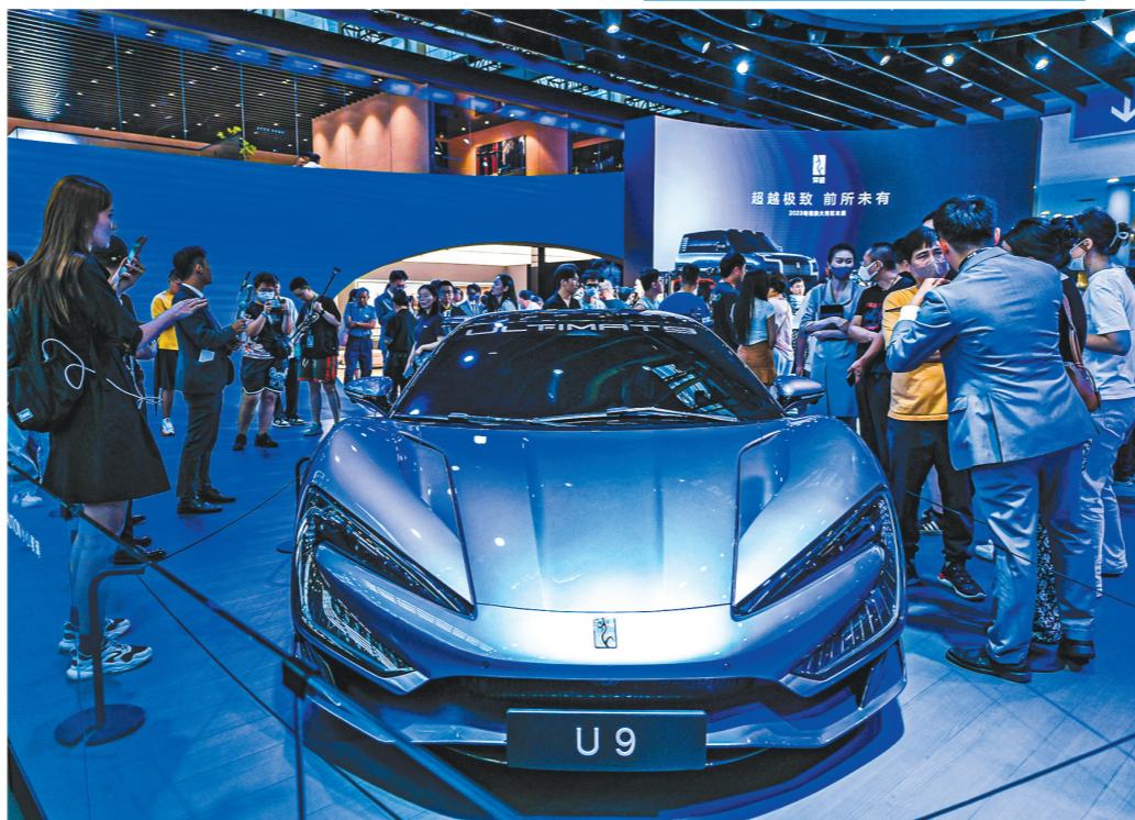
比亚迪首次以专馆形式整体参展