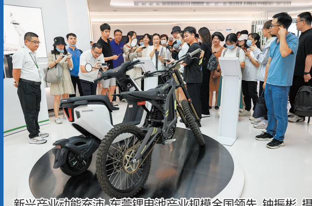
新兴产业动能充沛,东莞锂电池产业规模全国领先