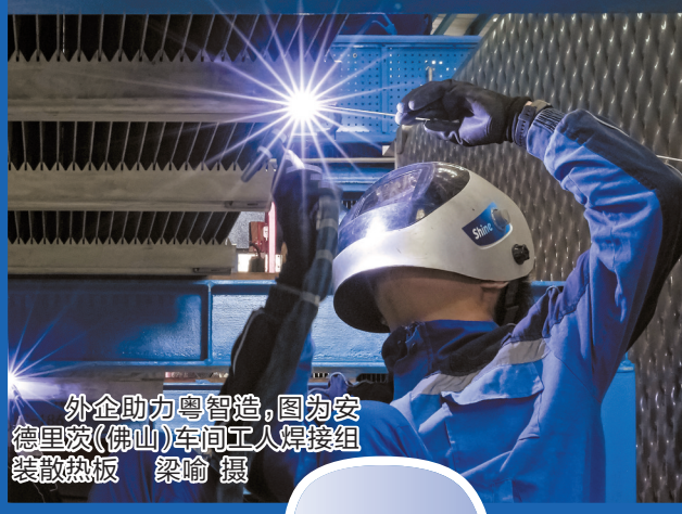
外企助力粤智造,图为安德里茨(佛山)车间工人焊接组装热板