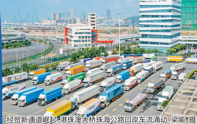
经贸新通道崛起,港珠澳大桥珠海公路口岸车流涌动

这恰如正在中国式现代化新征程上“乘风破浪”的广东,亿万人、一条心,以勇立潮头、敢为人先、攻坚克难的胆识气魄,以当仁不让、只争朝夕的姿态,锚定“走在前列”总目标,干在实处。