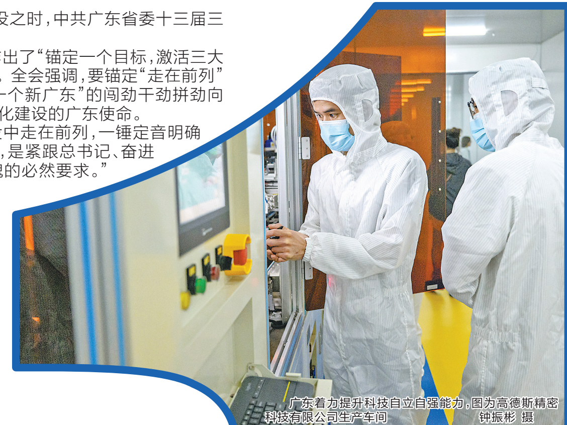
广东着力提升科技自立自强能力,图为高德斯精密科技有限公司生产车间

陈晓说,面对新形势新任务,广东摒弃守的心态、振奋创的精神,旗帜鲜明提出“再造一个新广东”,吹响全省高质量发展的冲锋号,努力在改革发展上一马当先,在战风斗雨中立马阵