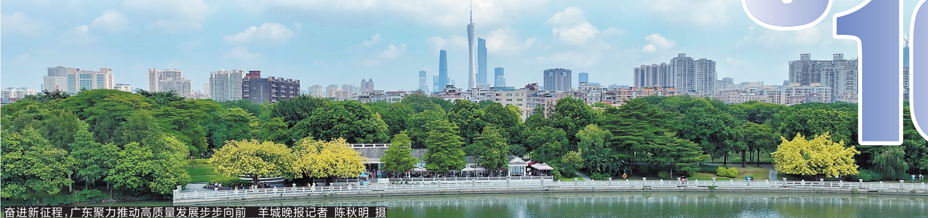
奋进新征程,广东聚力推动高质量发展步步向前

锚定“走在前列”总目标,广东要有一往无前的豪情。“在全面深化改革、扩大高水平对外开放、提升科技自立自强能力、建设现代化产业体系、促进城乡区域协调发展等方面继续走在全国前列,在推进中国式现代化建设中走在前列”,已清晰指明新征程广东的着力点、突破点、方向、目标、路径更加清晰,前进的道路豁然开朗。“走在前列”呼唤新担当新作为,我们要以“再造一个新广东”的闯劲干劲拼劲再出发,摒弃守的心态、振奋创的精神,在继往开来中再闯新路,在苦干实干中再创新业,在攻坚克难中再开新局,以走在前列的奋斗与业绩,努力创造让世界刮目相看的新的更大奇迹。