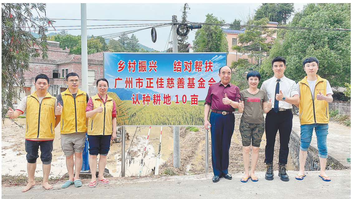
正佳慈善基金会结对帮扶,在梅州黄槐镇认种10亩耕地

中播撒下希望的种子。山海虽远,情谊相连。深化东西部协作和定点帮扶工作离不开全社会参与。近年来,正佳慈善基金会积极协助广东省粤黔协作工作队毕节工作组七星关小组开展工作,多次赴七星关,助力帮扶。同时,正佳慈善基金会向七星关捐赠电脑、课桌、衣服、食品等乡村振兴物资,为困难学生发放助学金,合计价值超600万元。