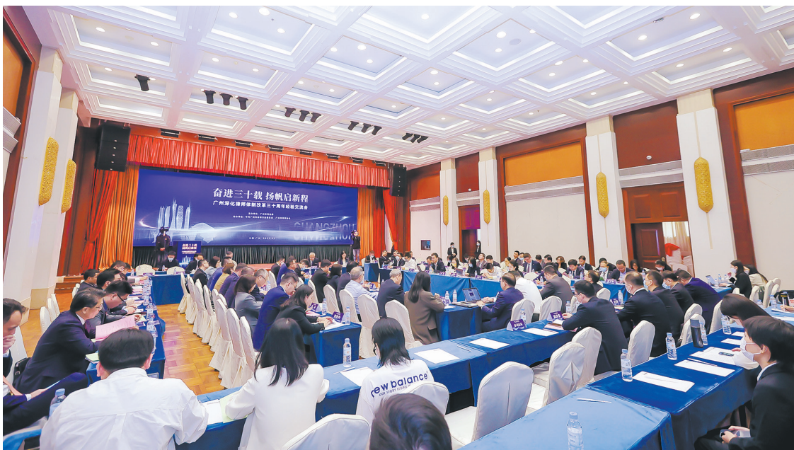
广州深化律师体制改革三十周年专题经验交流座谈会现场

创新旧楼加装电梯法治保障体系,是广州市司法局把学习贯彻党的二十大精神落在解决群众急难愁盼问题的一个生动实践。广州市司法局党委书记、局长邓中文表示,广州市司法局持续深入学习贯彻习近平法治思想,扎实推进主题教育见行见效,坚持党建引领,以全面依法治市为抓手,通过“六法融合”持续打造法治城市标杆,增强人民群众的法治获得感、幸福感、安全感,带动基层法治建设不断向纵深推进,以实干实绩实效交出法治护航高质量发展的高分答卷。