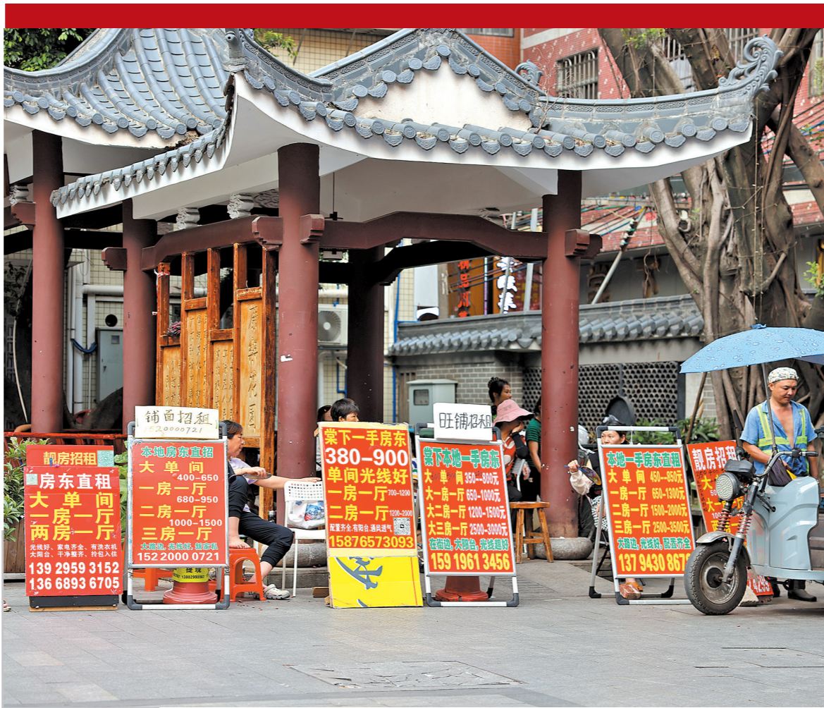
城中村因低廉的租金吸引着不少租客