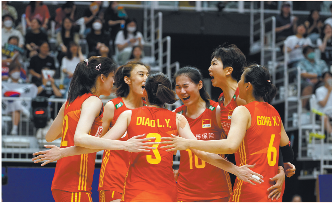
中国队在此前的分站赛上庆祝得分