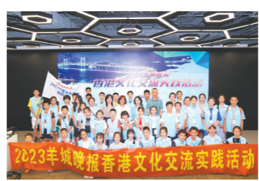
2023羊城晚报香港文化交流实践活动营前新闻集训暨出发仪式举行

观察世界的方法,她从自身丰富的采访经验出发,以一个个鲜活生动的案例搭建起连接学生记者与新闻知识的桥梁,让学生记者带着满满的干货整装待发。 授旗吹响集结号,当好文化交流小使者