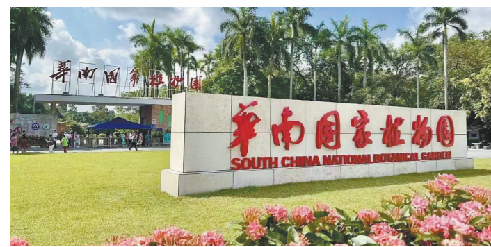
华南国家植物园

近年来,广东全力建设涵盖森林、湿地、自然保护区、国有林场等各类型自然资源的省级自然教育基地,推动各地建设各类市、县(区)级的自然教育中心、自然学校和自然学堂,着力构建省、市、县(区)等多层级的自然教育基地体系。 随着广东省自然教育体系逐渐形成并完善,涌现出了丹霞山世界地质公园、广州海珠国家湿地公园、华南国家植物园、深圳华侨城湿地公园、广东树木园等一批类型丰富、特色鲜明的自然教育特色场所。